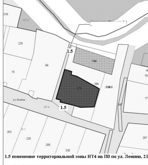
1.5 изменение территориальной зоны ИТ4 на П0 по ул. Ленина, 21