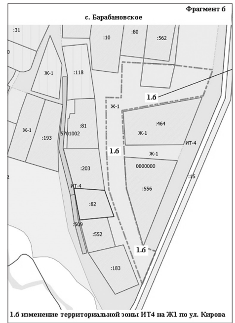
1.6 изменение территориальной зоны ИТ4 на Ж1 по ул. Кирова