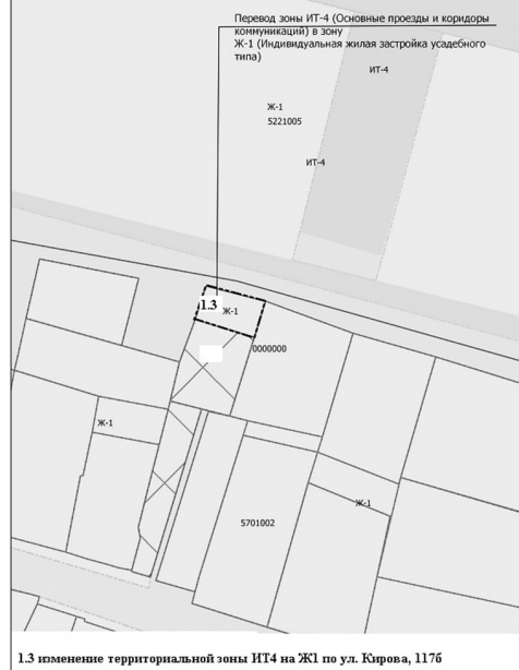
1.3 изменение территориальной зоны ИТ4 на Ж1 по ул. Кирова, 117б