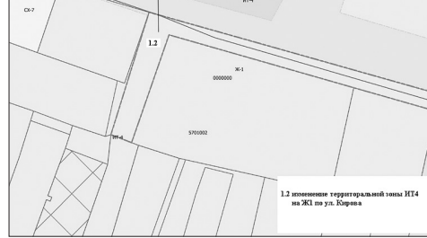
1.2 изменение территориальной зоны ИТ4 на Ж1 по ул. Кирова