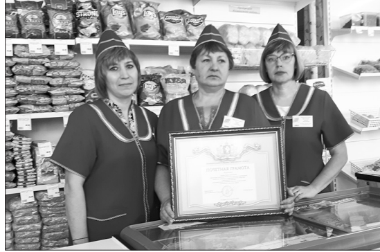
Коллектив продуктового магазина в Клевакинском награжден за хорошую работу

По пути в Клевакинское мы заехали в мастерские ПАО «Каменское», чтобы вернуть генератор. Оказывается, практически каждый рабочий день руководителей РайПО начинается с телефонограмм об отключении электроэнергии в разных концах района, на которые нужно очень оперативно реагировать. То есть срочно развезти бензиновые генераторы в магазины, попавшие в зону обесточивания. Иначе их работа будет парализована: нет электричества – не работают кассы, холодильные камеры, нет света. Значит, люди останутся даже без молока и хлеба, какие-то продукты попортятся, не будет выручки. Энергетики же не церемонятся, как правило, отключают электричество вразброс. Вот и приходится метаться по всему району. Когда не хватает собственных семи генераторов, выручает ПАО «Каменское», поясняют собеседники. Это одна из реалий, в которых сегодня приходится работать кооператорам.