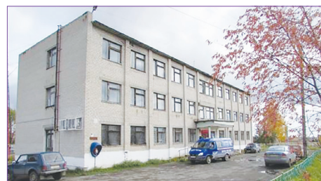
Бывшее здание конторы совхоза им. Ленина

Предприятие также занимается растениеводством, главным образом стараясь обеспечить кормами животных. Отрасль животноводства в полном объеме обеспечена грубыми и сочными кормами собственного производства. В 2018 г. произведено валовой продукции в действующих ценах на сумму 79 млн. руб., что составило 103% к уровню 2017 г.