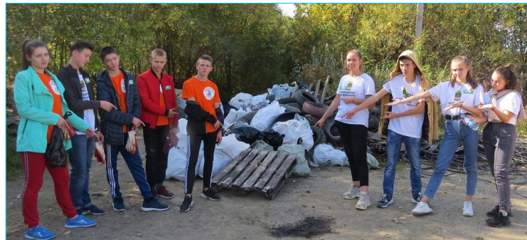
Трудовые отряды из Мартюша и Травянского