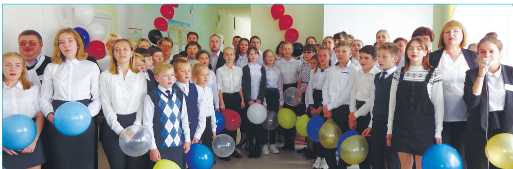
Педагоги и ученики Каменской школы рады открытию центра