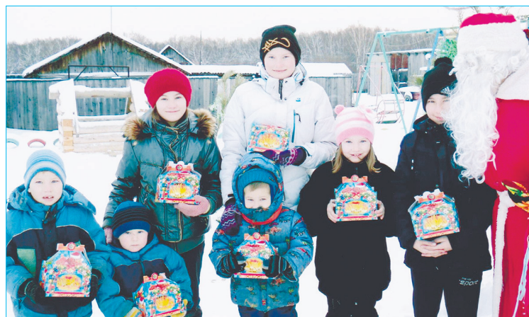
Дети рады подаркам от неравнодушных односельчан