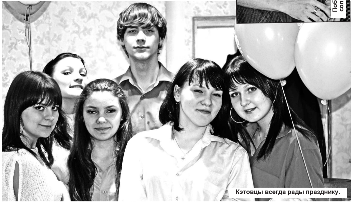
Кэтовцы всегда рады празднику.