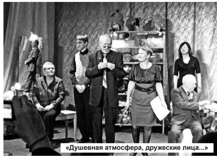
«Душевная атмосфера, дружеские лица...»

Праздник театра длился почти три часа. За все это время актеры вспоминали сцены из любимых спектаклей, играли запомнившиеся зрителю отрывки: то пеньки ходят, то