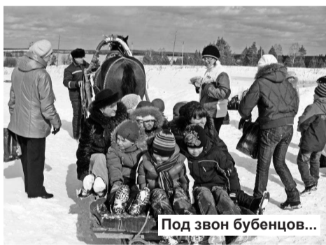
Под звон бубенцов...

Выйдя из автобуса и пройдя короткий инструктаж, дети попадали в настоящую сказку с неизменными персонажами русских праздников: Зимой, Медведем, Скоморохом, Бабой Ягой, приветствовавших гостей. И, конечно, играли с ними. Состязание в перетягивании каната не оставило равнодушными даже родителей, они с азартом помогали своим ча-