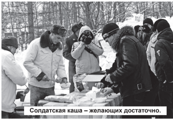
Солдатская каша – желающих достаточно.