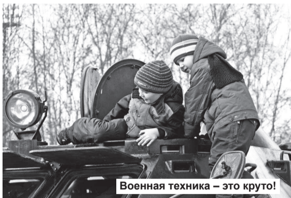
Военная техника – это круто!

В 11.30 раздаются звуки военного оркестра, военнослужащие строем проходят перед обелиском Победы: праздник начинается!