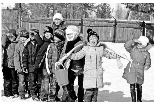
Веселый конкурс! Таких было много.