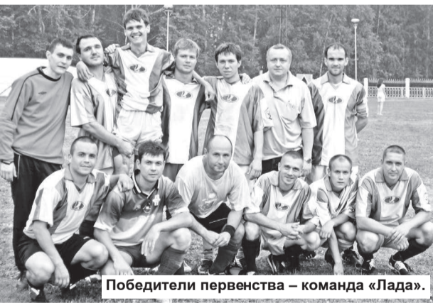
Победители первенства - команда «Лада».

22-23 марта в манеже нижнетуринской ДЮСШ прошла 47 матчевая встреча городов Урала и Сибири по легкой атлетике. В соревнованиях приняли участие спортсмены из Ирбита, Новоуральска, Баранчи, Качканара, Верхотурья, Серова, Нягани, Аюгорска, Нижней Туры и Алапаевского района. В течение двух дней легкоатлеты соревновались в 5 возрастных категориях и разыграли 26 комплектов медалей. Нижнетуринские спортсмены разного возраста заняли свои места на пьедестале.