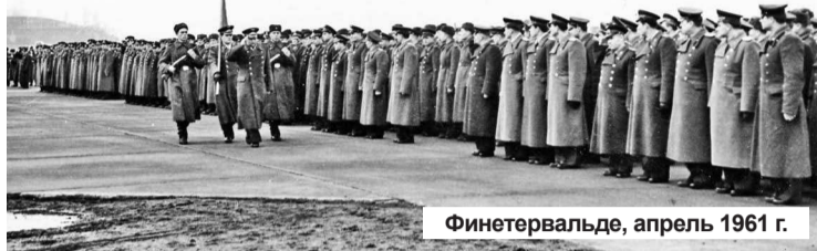
Финетервальде, апрель 1961 г.

Нас выстроили перед казармой для очередного развода по работам, кого на боевое дежурство, кого – на КПП, кого – в гараж, кого – в Ленинскую комнату. Единственное, что нас равняло со стрелковой частью, занимавшейся охраной бомбосклада и аэродромного хозяйства, подмена ее один раз в месяц. А все остальные дни мы были заняты изучением материальной части и доведением своих действий до автоматизма. Развод вел капитан ВВС Махинов. Все офицеры находились вместе со своими подразделениями. Мы заметили, что солдаты роты связи на здании нашей казармы, принадлежащей роте земного обеспечения самолетов, устанавливают громкоговоритель. Капитан Чичканенко вынес флаг части. Наша шеренга прониклась духом торжественности, все подтянулись. И тут из репродуктора раздался голос Левитана: «Внимание! Говорит Москва! Включены все радиостанции Советского Союза! Сегодня, 12 апреля 1961 года, в Советском Союзе произведен запуск космического корабля с человеком на борту. Корабль пилотирует летчик-космонавт капитан Юрий Гагарин. ЦК КПСС поздравляет весь советский народ с великой победой!»