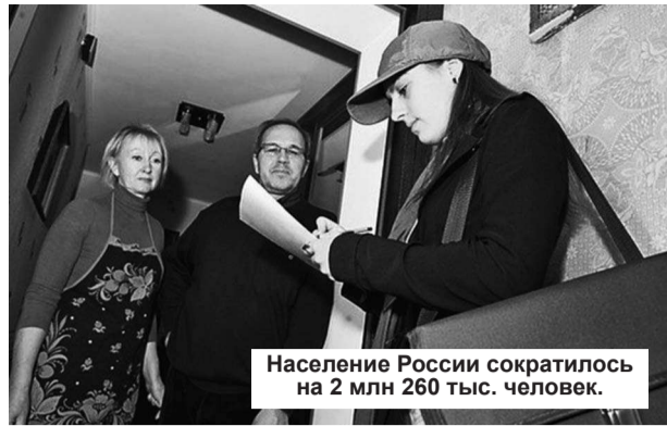
Население России сократилось на 2 млн 260 тыс. человек.

Подведены первые итоги Всероссийской переписи населения, которая проводилась с 14 по 25 октября 2010 года. Пока доступны лишь данные по численности городского и сельского населения и количеству мужчин и женщин. Однако уже этих цифр достаточно, чтобы подвести печальные итоги 2000-х – жителей страны стало меньше более чем на 2,2 миллиона человек, а разрыв между численностью мужчин и женщин увеличился еще больше.