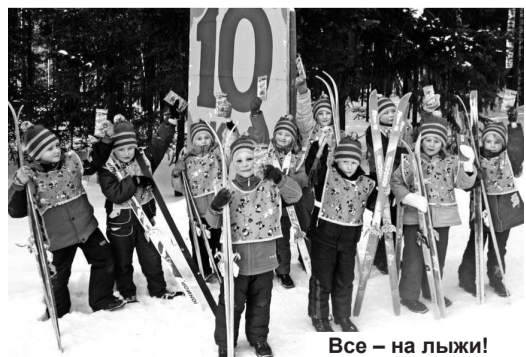
Все – на лыжи!