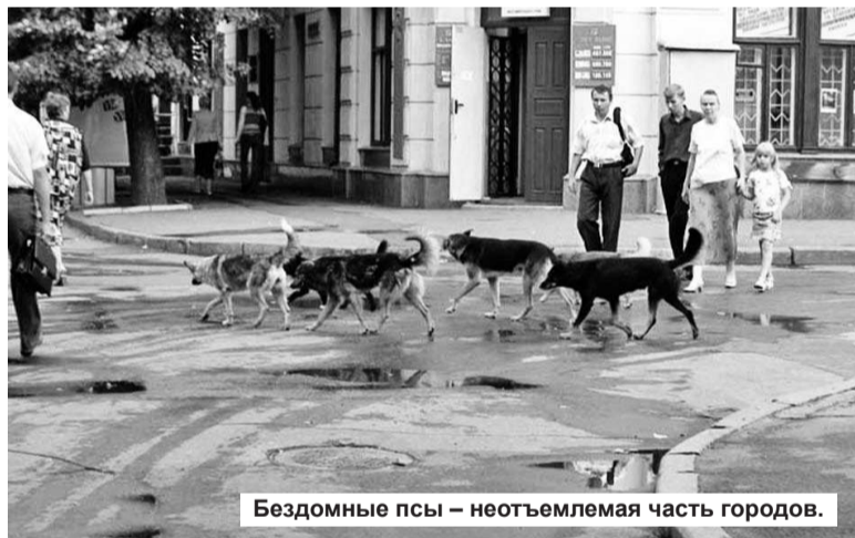
Бездомные псы – неотъемлемая часть городов.