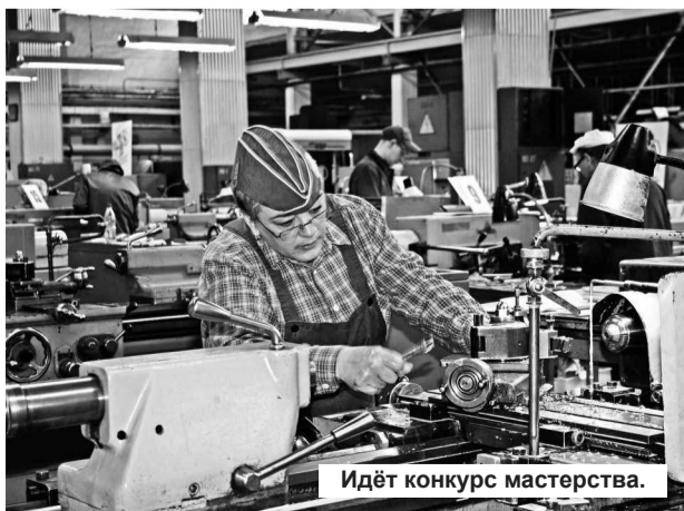
Идёт конкурс мастерства.

Информационно-аналитический центр ФГУП «Комбинат «Электрохимприбор».