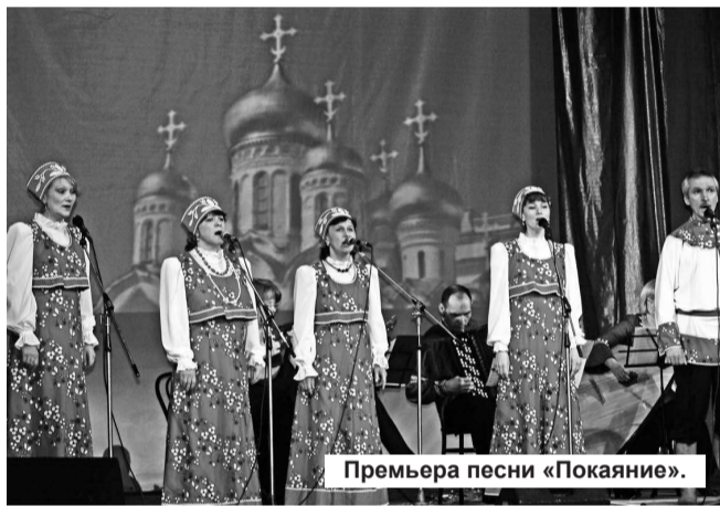
Премьера песни «Покаяние».