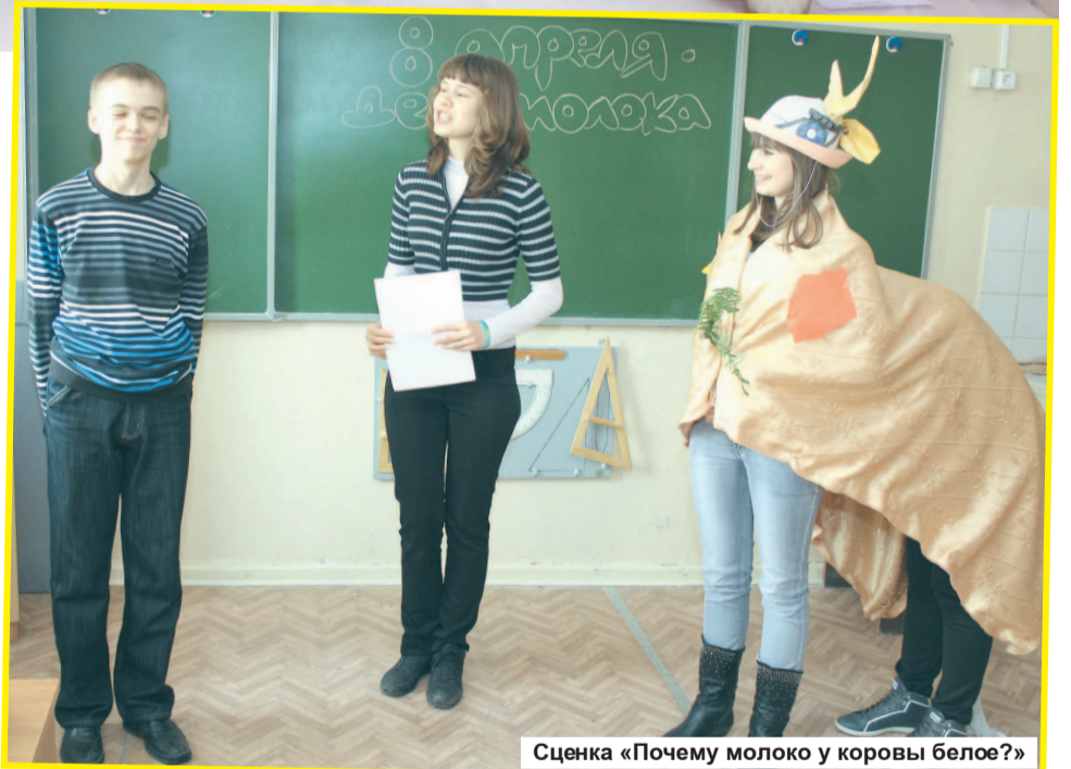
Сценка «Почему молоко у коровы белое?»

их большой ценности. А ведь о полезных свойствах молока знали еще наши предки, задолго до нашей эры. Им были известны способы лечения болезней различными видами молока. С молоком также связано и открытие витаминов. Известно, например, что коровье молоко полезно при различных простудных заболеваниях, оно поможет и при бессоннице.