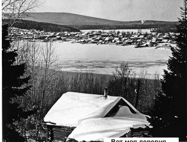
Вот моя деревня...