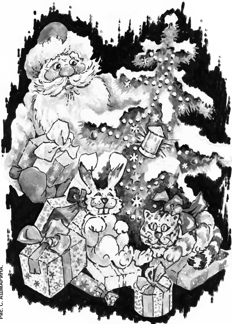
Рис. С. АШМАРИНА.

На полянку и лужок С неба падает снежок.