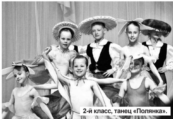
2-й класс, танец «Полянка».

А теперь о том, что нового. Впервые, пожалуй, отчетный концерт был составлен не просто из всех номеров, что создавались в течение учебного года, он был объединен единой темой – «Наш дом – планета Земля!». И в него вошли танцы