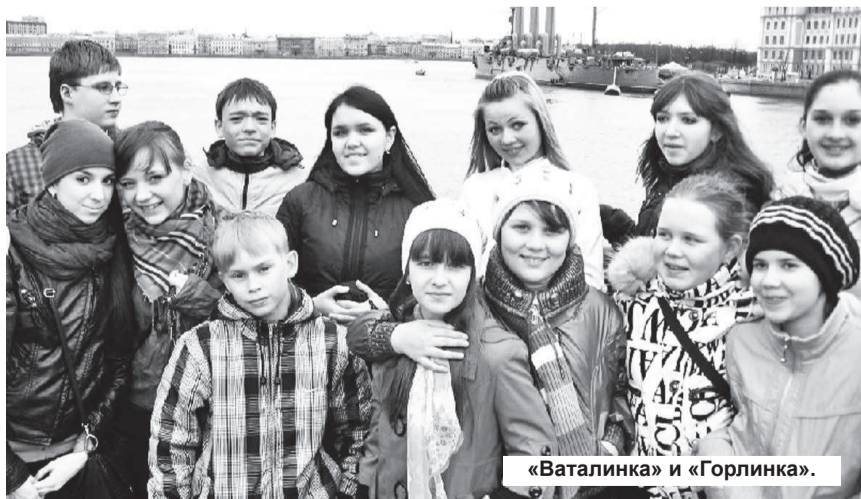
«Ваталинка» и «Горлинка».