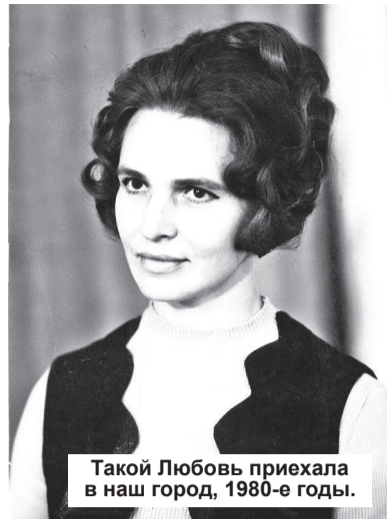
Такой Любовь приехала в наш город, 1980-е годы.