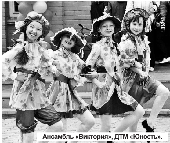
Ансамбль «Виктория», ДТМ «Юность».

Всегда приятно начинать материал со слова «впервые». Сегодня у меня есть такая замечательная возможность. Впервые 15 мая красиво и празднично был открыт летний парковый сезон. А новое дело, согласитесь, лучше спорится, если делать его сообща.