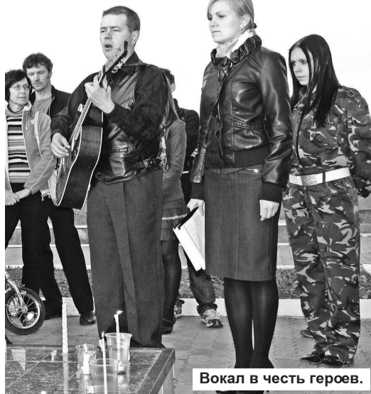
Вокал в честь героев.