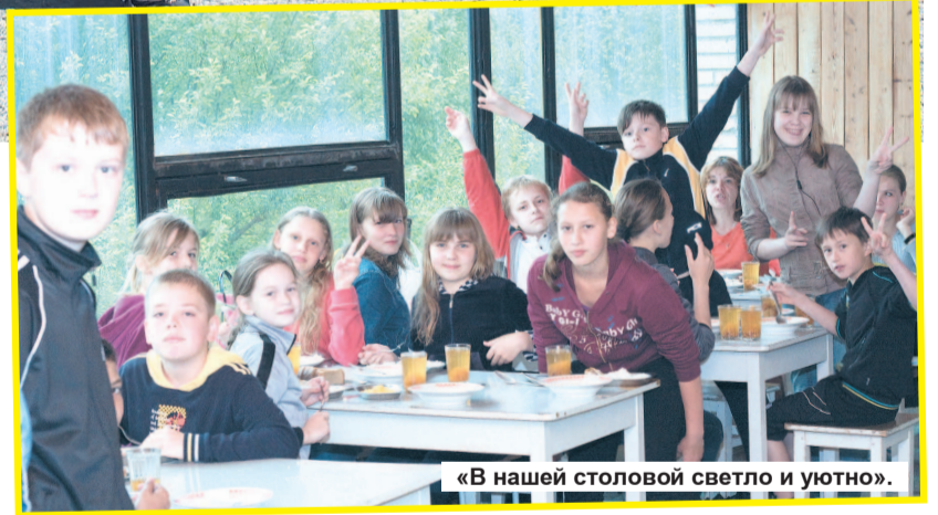
«В нашей столовой светло и уютно».

Можно сказать, что отдых в санатории-профилактории «Солнышко» – маленькое счастье для детей Лесного, для тех, кто посетит