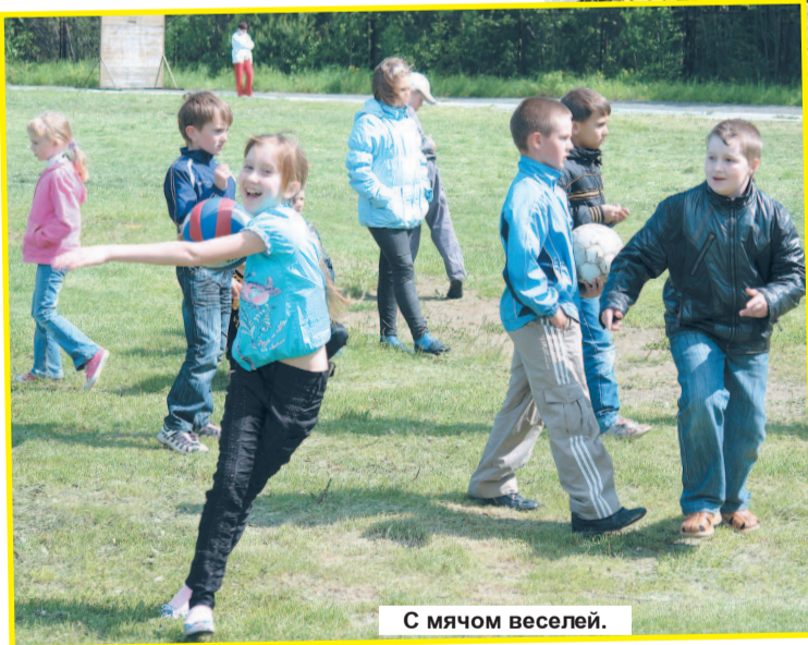
С мячом веселей.

ное: когда ребята-дагестанцы начинают танцевать лезгинку, весь лагерь встает вокруг них и наблюдает за ними с замиранием сердца. Наши девочки в восторге от этих мальчишек. Настолько сдружились, что расставаться с ними не хотят. Это замечательные ребята! Они так галантно ухаживают за нашими девочками! Несомненно, в формировании таких замечательных отношений между ребятами большую роль играет вожатский и вос-