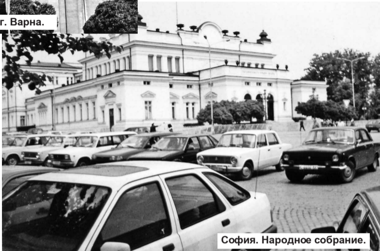
София. Народное собрание.