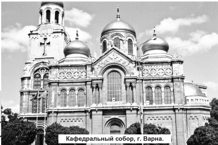
Кафедральный собор, г. Варна.

дителях, а у людей среднего и старшего возраста еще есть и ностальгия по временам социализма. Болгары старшего и среднего возраста будут к вам весьма доброжелательны и гостеприимны, а вот молодые – не всегда. Новые веяния повлияли на эти отношения. Более 80% доходов современной Болгарии приносит туризм, а по количеству ежегодно приезжающих туристов Россия занимает седьмое место, уступая Германии, США, Великобритании, Франции, Италии, Канаде и находясь на одном уровне с Голландией. К тому же западноевропейцы не скупаются на щедрые чаевые, отодвинув русских в этом смысле на второй план. Примеры симпатии болгар по отно-