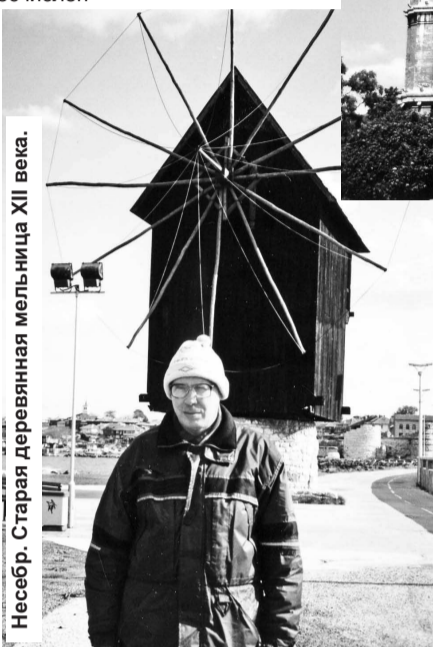
Несебр. Старая деревянная мельница XII века.

Отношение к русским в Болгарии хорошее. Оно складывается из доброй памяти об освобо-