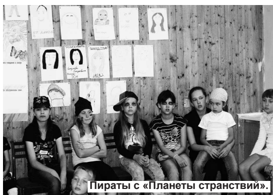
Пираты с «Планеты странствий».

Отряды располагаются в зданиях второго и пятого клубов, но, несмотря на это, воспитатели стараются объединять их для проведения игровых мероприятий. Так, например, 29 июля на базе второго клуба состоялся межотрядный День пирата.