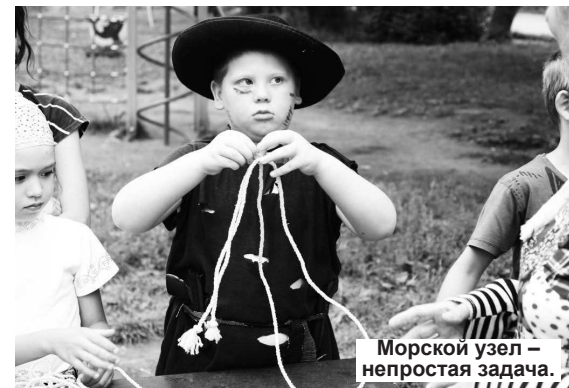
Морской узел – непростая задача.

Н. ПЕРВУШКИНА.