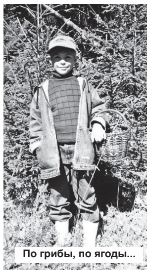
По грибы, по ягоды...

Медики предостерегают не совсем здоровых людей от включения этого продукта