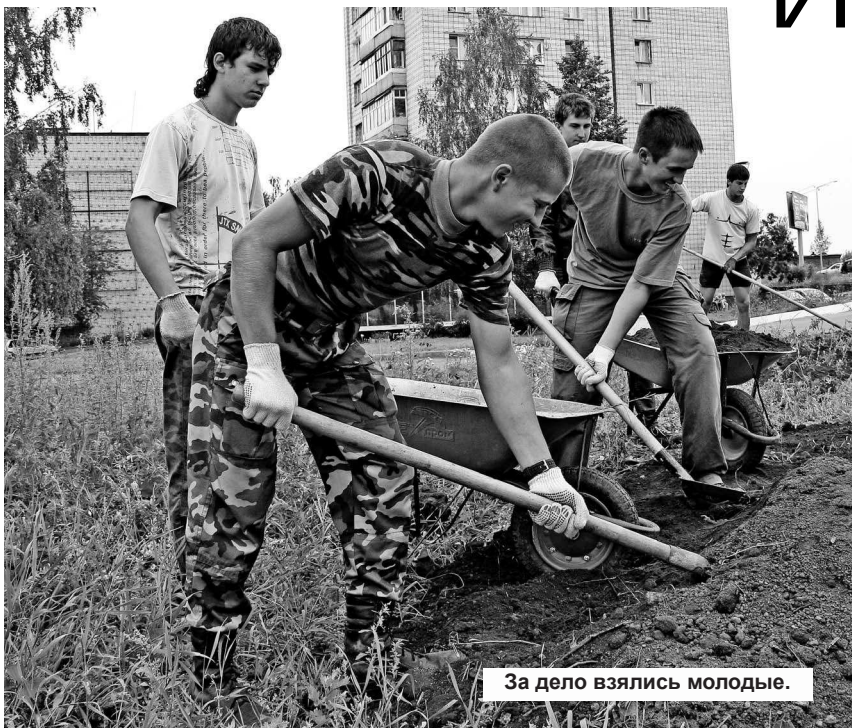
За дело взялись молодые.