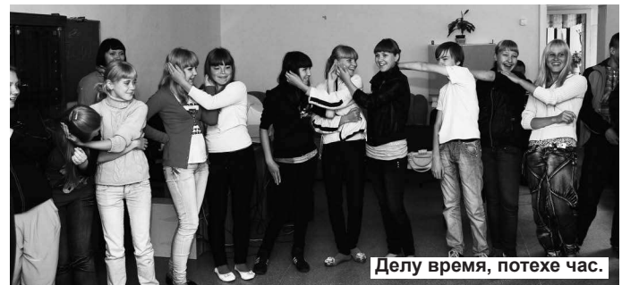
Делу время, потехе час.