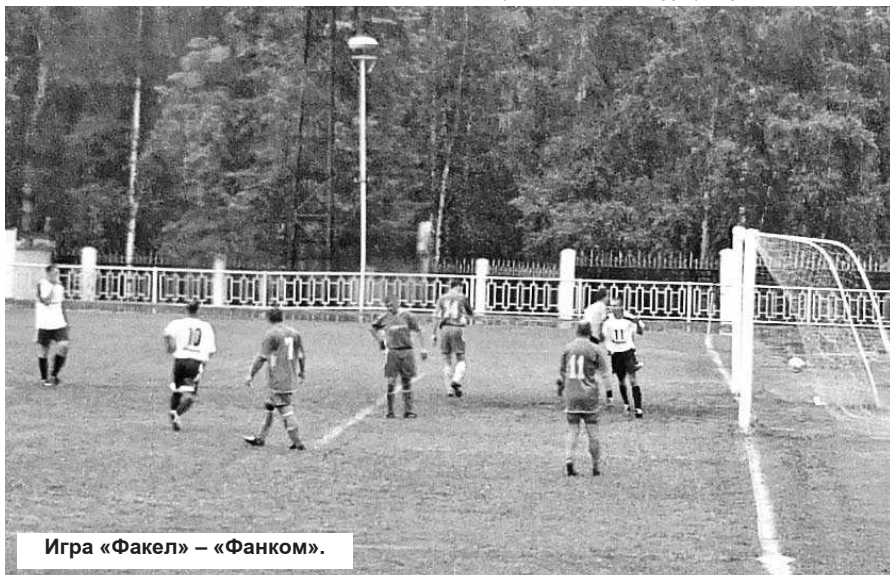
Игра «Факел» – «Фанком».