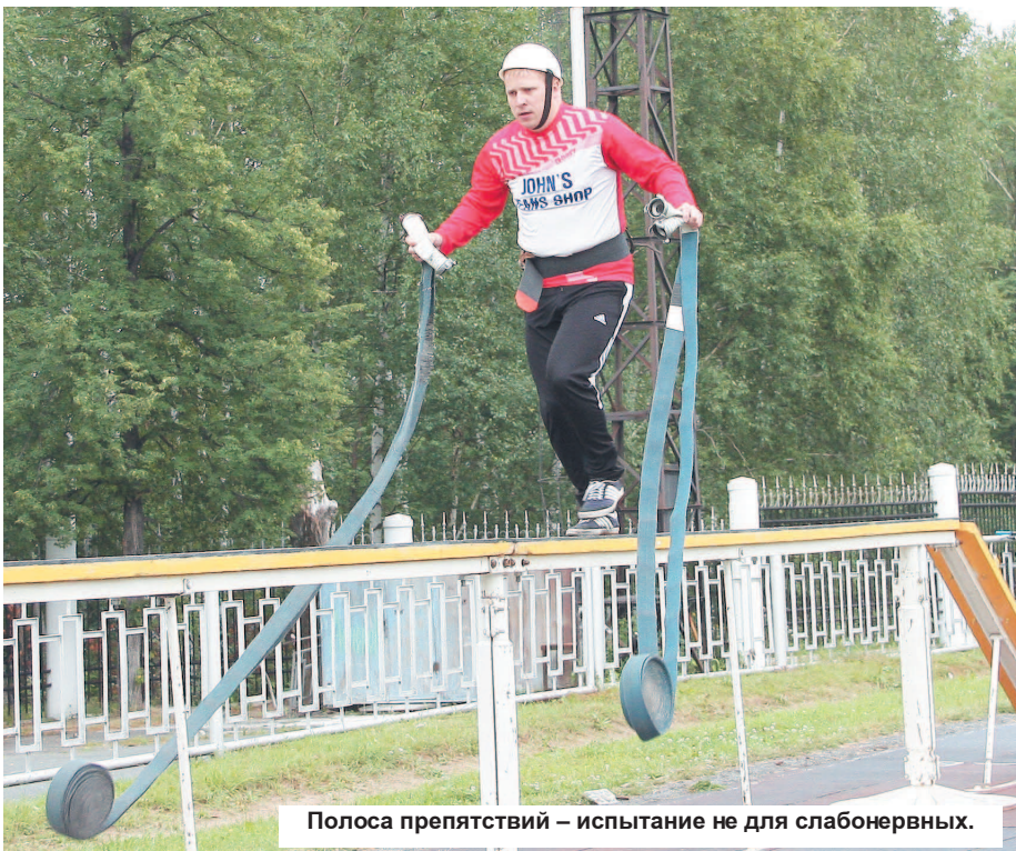
Полоса препятствий – испытание не для слабовольных.