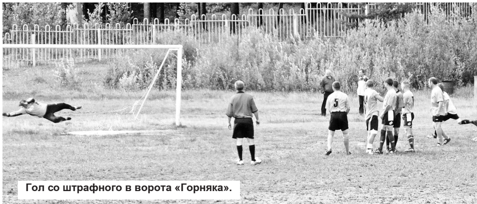
Гол со штрафного в ворота «Горняка».