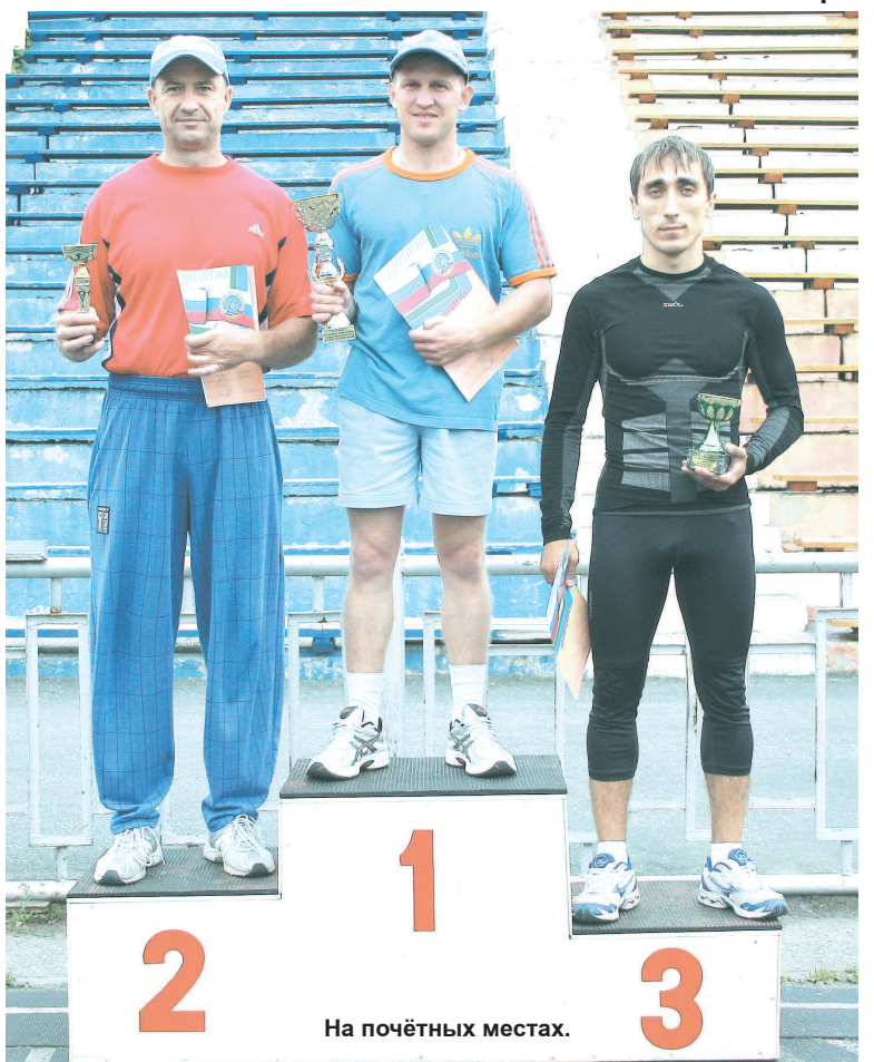
На почётных местах.

г. Нижняя Тура ул. Молодежная, 6 сот. 8-922-160-27-85 г. Лесной ул. Мира, 30 сот. 8-922-109-51-21