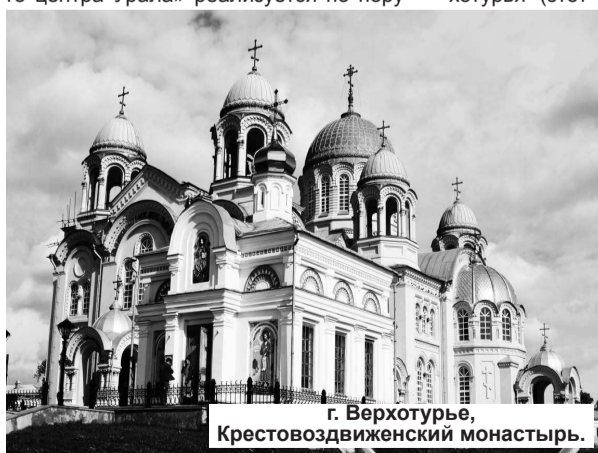
г. Верхотурье, Крестовоздвиженский монастырь.

Программа формирования «Духовного центра Урала» реализуется по поручению президента России и по благословению патриарха Кирилла и предусматривает работу по трем основным направлениям: создание объектов туристского показа на базе историко-культурного и духовного наследия Верхотурья (этот город считается православной столицей Урала) и села Меркушино, развитие инфраструктуры и социально-экономическое развитие соответствующих муниципалитетов.