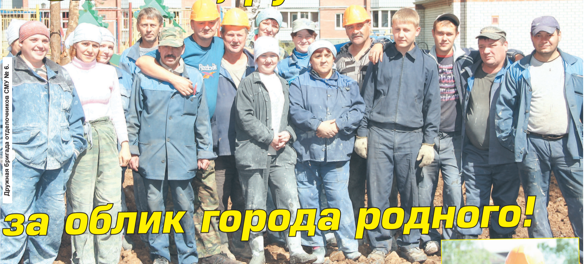
Дружная бригада отделочников СМУ № 6.