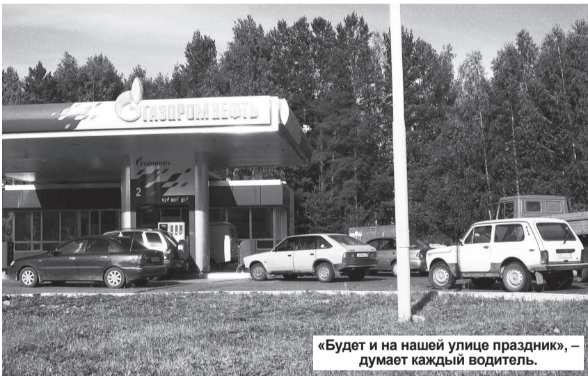
«Будет и на нашей улице праздник», – думает каждый водитель.

В конце июля практически на всех автозаправочных станциях нашего города резко исчез самый ходовой бензин – АИ-92, а также АИ-95.