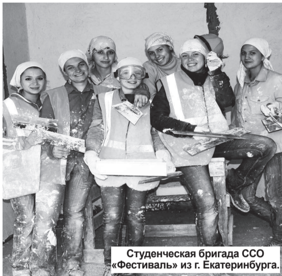
Студенческая бригада ССО «Фестиваль» из г. Екатеринбурга.

День строителя – профессиональный праздник отмечают все, кто так или иначе имеет отношение к этому благородному делу: строители, архитекторы, проектировщики, работники промышленности стройматериалов, ветераны отрасли и ее современный кадровый состав.