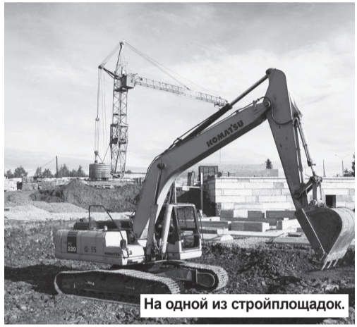
На одной из стройплощадок.