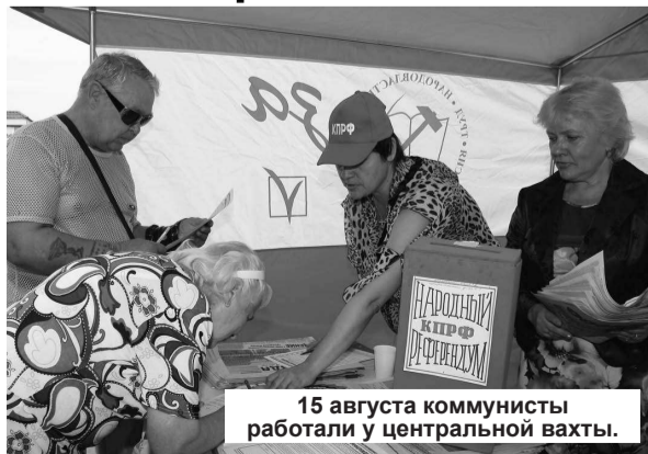
15 августа коммунисты работали у центральной вахты.