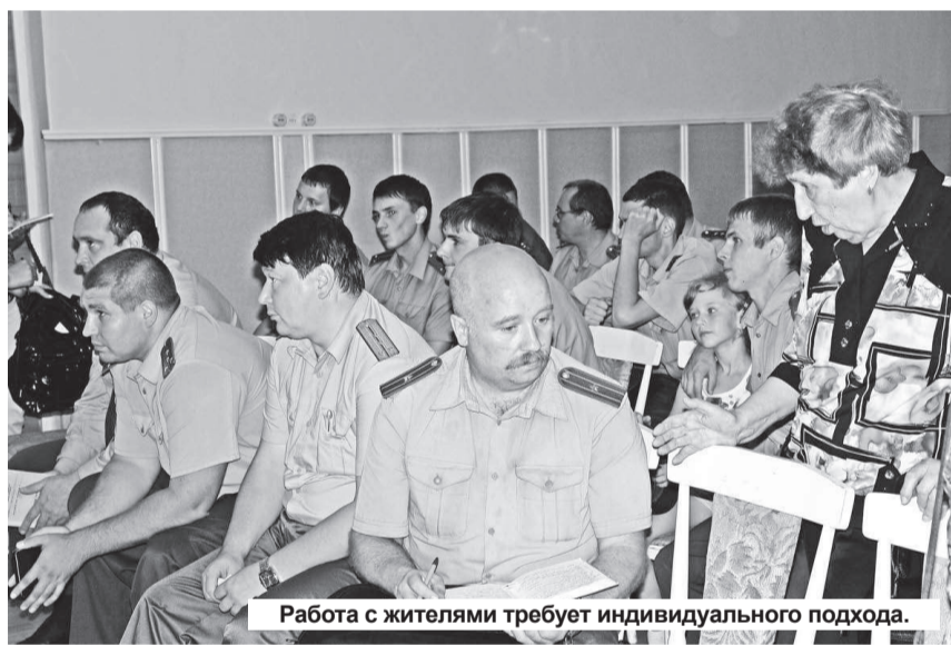
Работа с жителями требует индивидуального подхода.