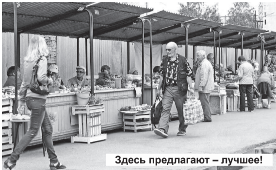
Здесь предлагают – лучшее!

Не так давно в номере 29 газеты «Ра- дар» от 21 июля 2011 года была опу- бликована статья «Все трудности – временны?» В ней шла речь об ак- тивной реализации в Лесном в по- следнее время проектов по строи- тельству магазинов и торговых цен- тров. Да, несомненно, строитель- ство новых, современных торговых точек принесет пользу владельцам и, конечно же, лесничанам, которые будут их активно посещать, приоб- ретают различные товары. Однако в Лесном немало людей, которые, об- ходя торговые центры и магазины, спешат попасть на рынок и приоб- рести именно там свежие, натураль- ные, полезные продукты.