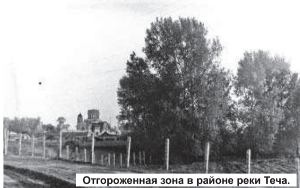
Отгороженная зона в районе реки Теча.

Н. БУШУХИНА, свидетель катастрофы.