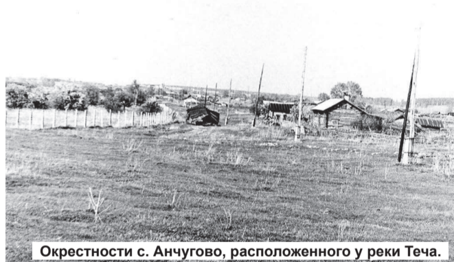
Окрестности с. Анчугово, расположенного у реки Теча.