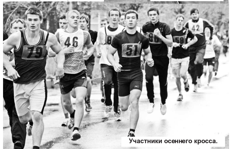
Участники осеннего кросса.