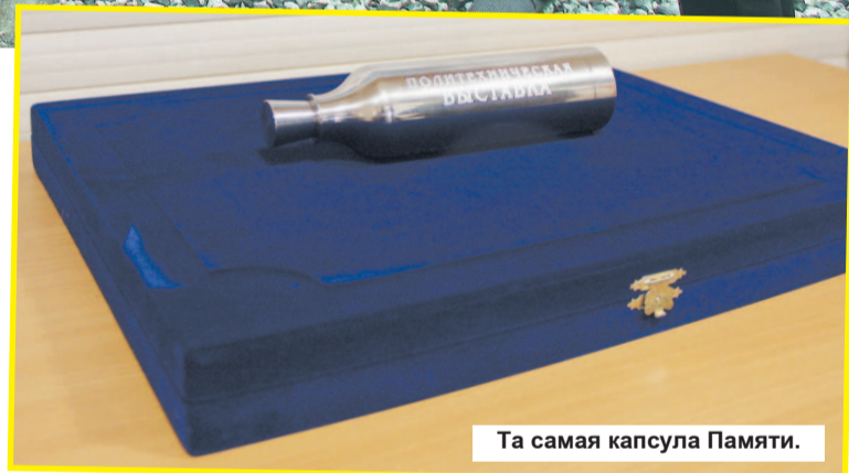
Та самая капсула Памяти.

После открытия именного стенда мы спецрейсом на небольшом автобусе отправились в учебно-выставочный центр. По прибытии на место нас встре-