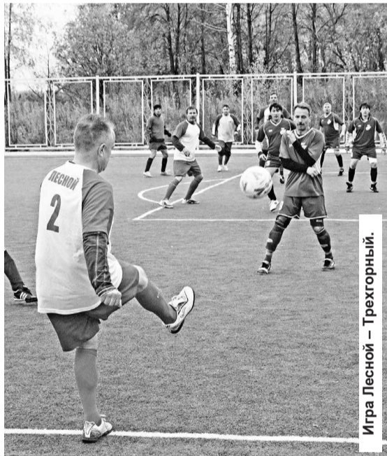
Игра Лесной – Трехгорный.