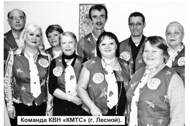
Команда КВН «КМТС» (г. Лесной).