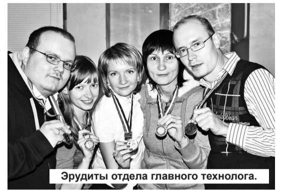
Эрудиты отдела главного технолога.