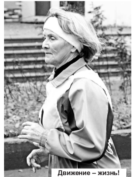
Движение – жизнь!

Записал И. НЕПРЕДВЯТЫЙ.