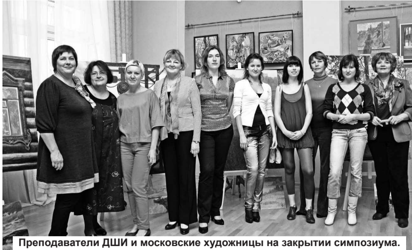
Преподаватели ДШИ и московские художницы на закрытии симпозиума.