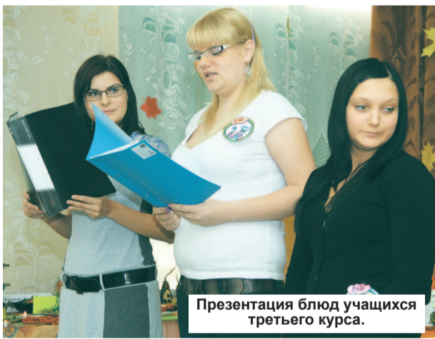
Презентация блюд учащихся третьего курса.