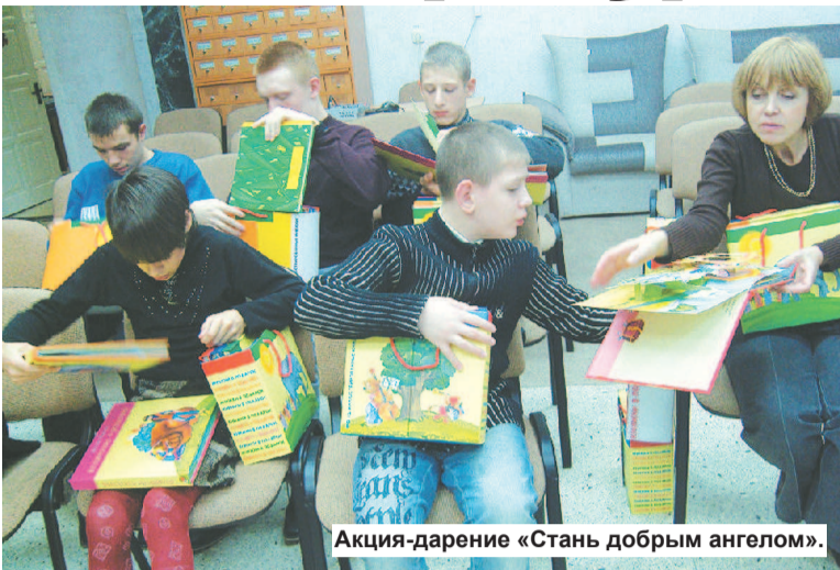
Акция-дарение «Стань добрым ангелом».

Он действительно стал таким для коллектива Центральной городской детской библиотеки! Урожайным на большие добрые дела!