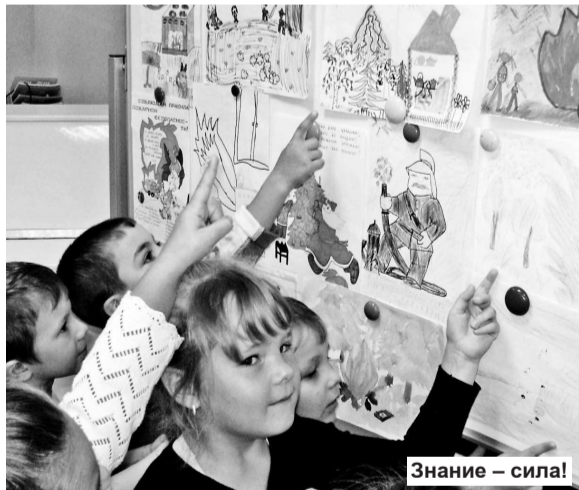
Знание – сила!

Знания оперативных действий педагогов и применение их на практике отражается в ходе тренировок по действиям в случае пожара в общеобразовательных учреждениях, специальных коррекционных школах и т.д. Учебная эвакуация прошла на 20 объектах. Практическая проверка выявила некоторые недоработки. К примеру, во время тренировок на