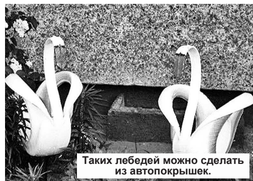
Таких лебедей можно сделать из автопокрышек.