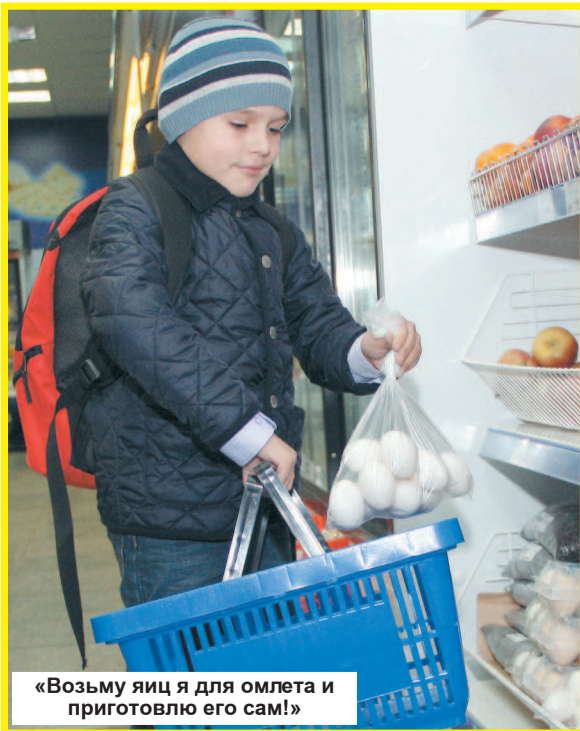
«Возьму яиц я для омлета и приготовлю его сам!»

Благодарим руководство кафе «Ермак» за помощь в организации фотосъемки.