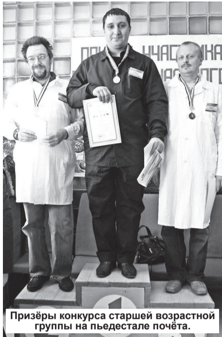
Призеры конкурса старшей возрастной группы на пьедестале почёта.

7 октября в ФГУП «Комбинат «Электрохимприбор» впервые состоялся конкурс профессионального мастерства среди слесарей контрольно-измерительных приборов и автоматики (КИПиА).