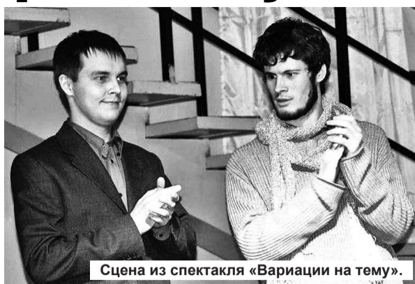
Сцена из спектакля «Вариации на тему».

Главный смысл этой большой работы члены театра видят в том, чтобы привлечь но-