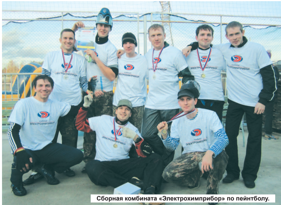
Сборная комбината «Электротехприбор» по пейнтболу.

8 и 9 октября в Озерске (Челябинская область) состоялся турнир между шестью пейнтбольными командами с предприятий «Росатома».