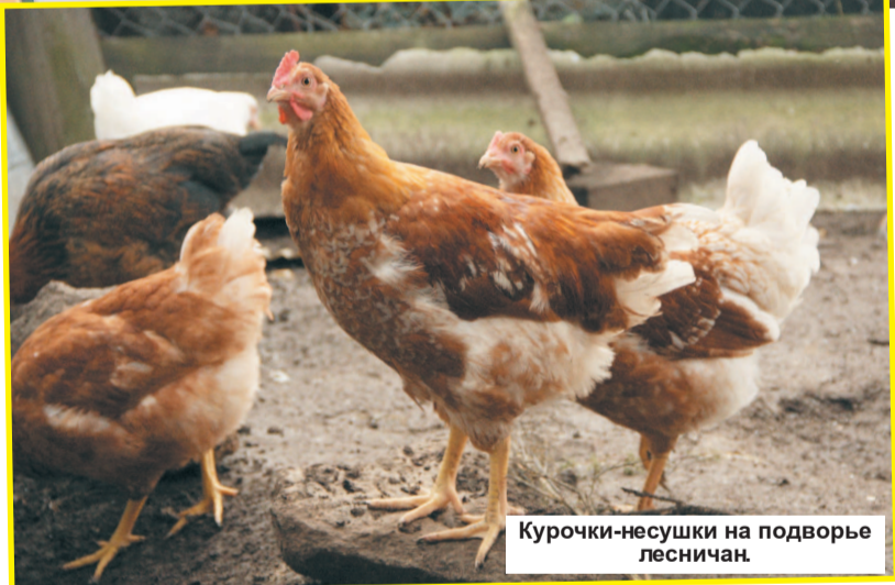
Курочки-несушки на подворье лесничан.

Несмотря на то, что это сам по себе уникальный про-