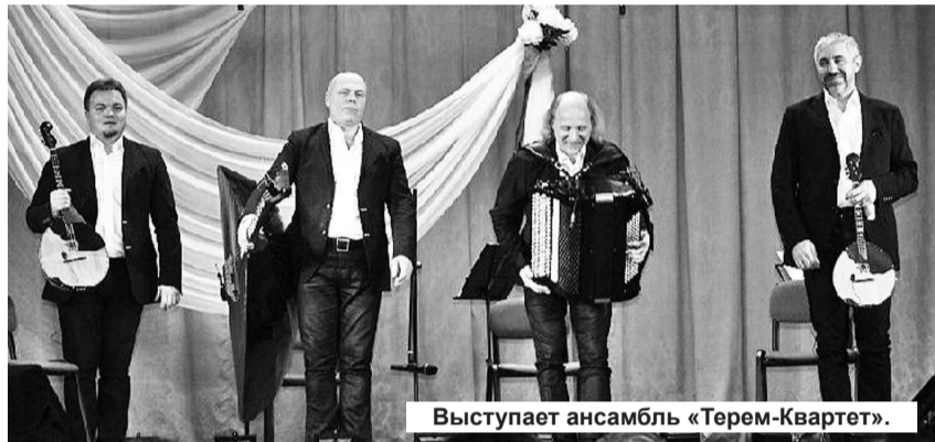
Выступает ансамбль «Терем-Квартет».