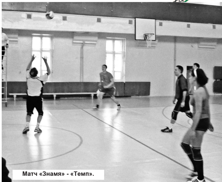
Матч «Знамя» - «Темп».