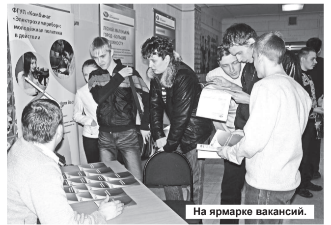
На ярмарке вакансий.

Также В.В. Рябцун отметил, что такая программа обучения предусматривает как традиционные аудиторные и лабораторные занятия, так и экскурсионные мероприятия для знакомства с производственными процессами предприятий Госкорпорации «Росатом», чем принципиально отличается от традиционной программы довузовской подготовки в рамках физико-математической школы ТИ «НИЯУ «МИФИ».