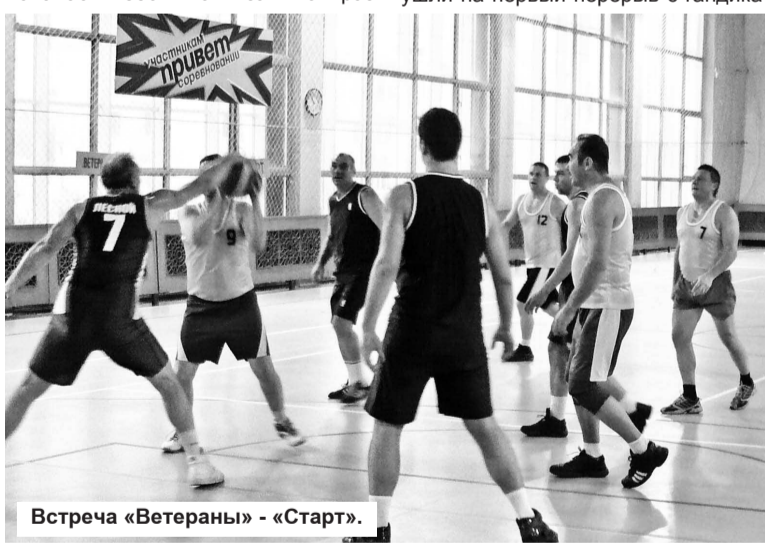
Встреча «Ветераны» - «Старт».

ведкой, а затем баскетболисты центра 112 предприняли мощный спурт и ушли на первый перерыв с гандика-