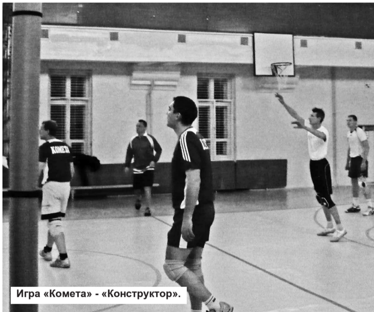
Игра «Комета» - «Конструктор».

Осенний кубок города. Мужчины. Лесной. Дворец Спорта «Факел». 20.11.2011.