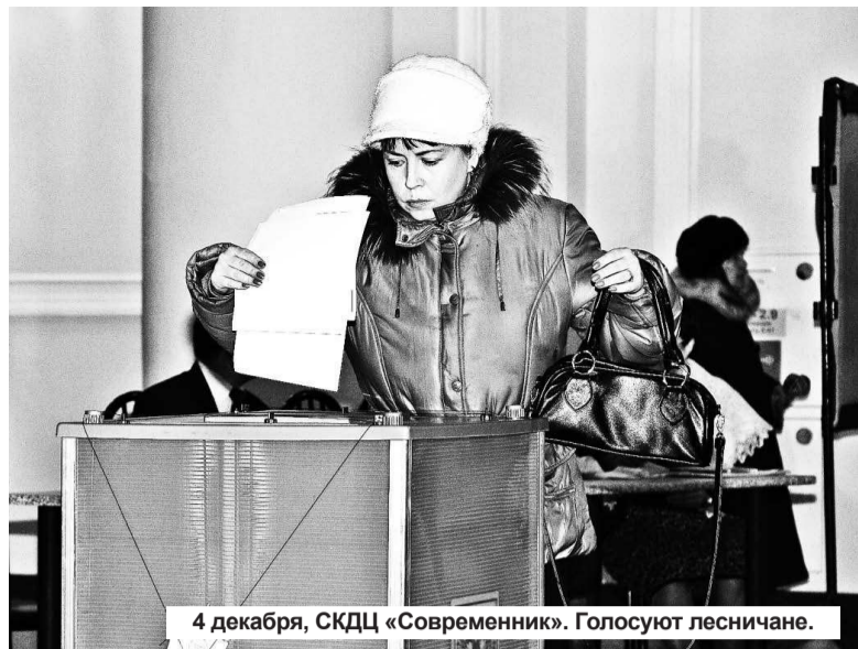
4 декабря, СКЦ «Современник». Голосуют лесничане.

Мне бы хотелось выразить уважение от Лесной городской территориальной комиссии неравнодушным гражданам, пришедшим на избирательные участки в минувшее воскресенье и сделавшим свой выбор. А также попросить прощения за предоставленное неудобство тем гражданам, у которых участки поменялись – город растет, но по закону мы пока не мо-