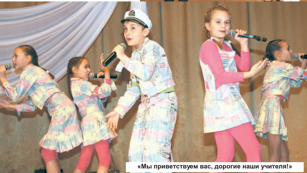
«Мы приветствуем вас, дорогие наши учителя!»