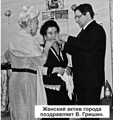
Женский актив города поздравляет В. Гришин.

Городской совет женщин выступил с инициативой проведения встречи женского общественного актива с руководством города. Из четырнадцати городских общественных организаций практически все возглавляют женщины, чей вклад в развитие общественного движения заметен и значителен.