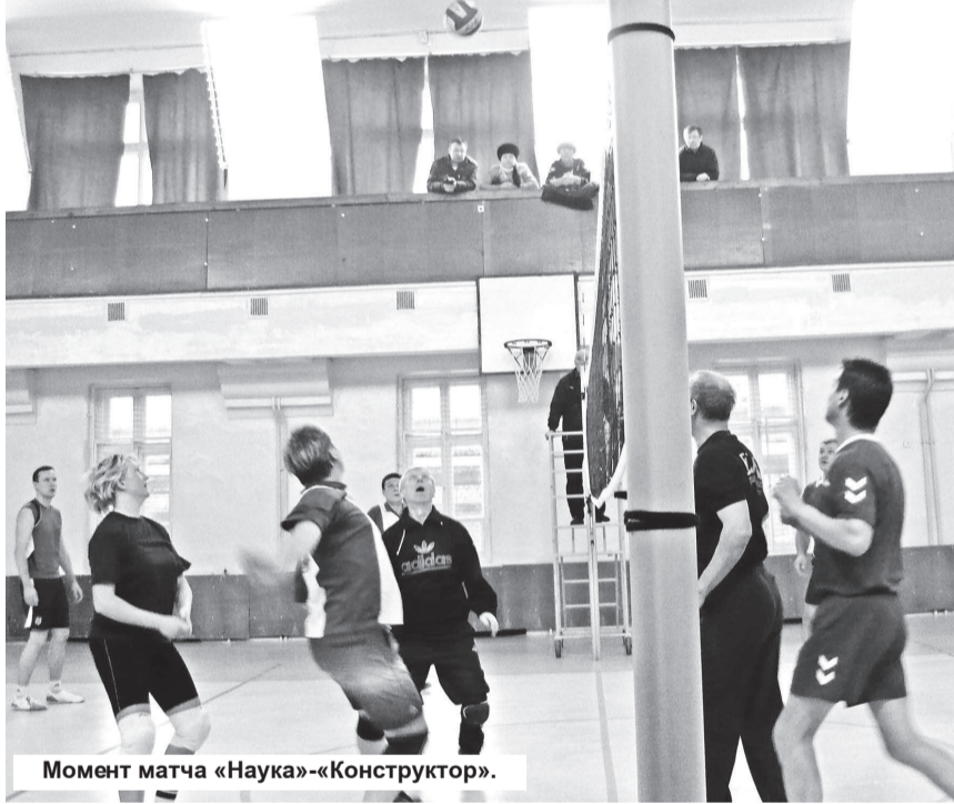
Момент матча «Наука»-«Конструктор».

27 ноября в Екатеринбурге прошла матчевая встреча ДЮСШ и СДЮСШОР городов Урала среди юношей и девушек 1997-1998 г.р.