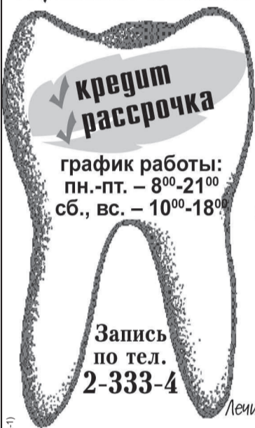
график работы: пн.-пт. – 8 00 -21 00 сб., вс. – 10 00 -18 00