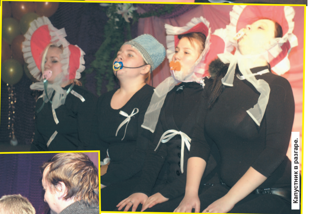
Капустник в разгаре.