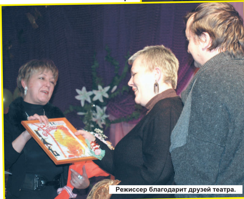
Режиссер благодарит друзей театра.