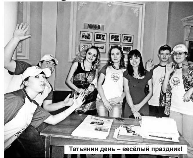
Татьянин день – весёлый праздник!