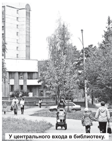
У центрального входа в библиотеку.

– Нет, нам сказали, что в «Бажовку» ходить будем.