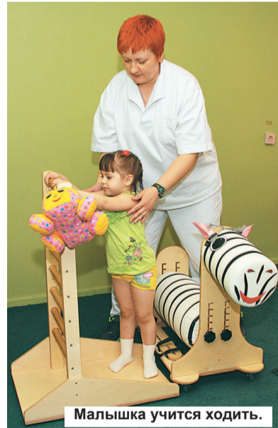
Малышка учится ходить.