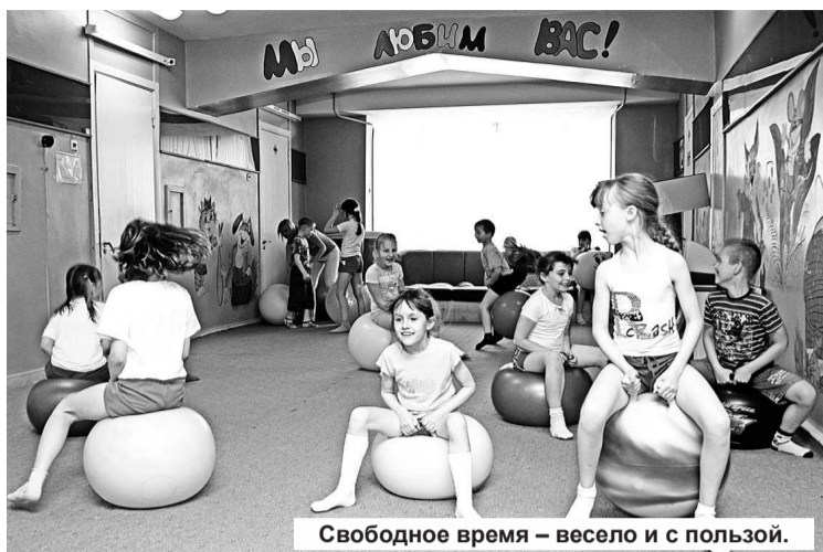
Свободное время – весело и с пользой.

Также мы работаем с беременными женщинами, водим их в бассейн, где с ними занимаются инструкторы. Стараясь охватить курсами реабилитации по всем направлениям, для этого применяем много технологий. В медсанчасти есть