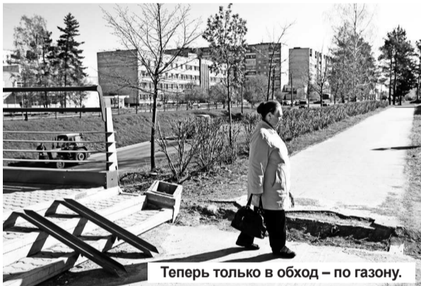
Теперь только в обход – по газону.

Очистили от грязи и мусора город в преддверии праздников. Да еще прошел дождик и зазеленела травка. А у СУСа, где стоит хлебный вагончик, расцвела яблонька. Все это – хорошо.