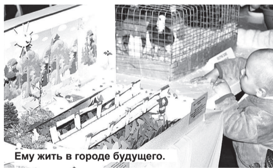
Ему жить в городе будущего.