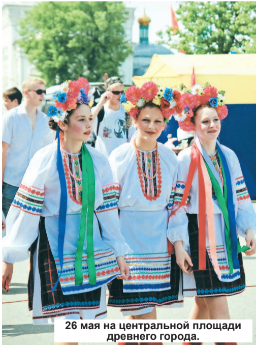
26 мая на центральной площади древнего города.

В последние майские дни тысячи паломников устремились в Верхотурье