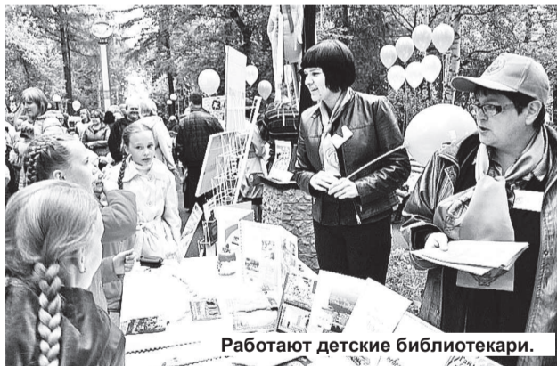
Работают детские библиотекари.

27 мая отмечается Общероссийский день библиотек, и, представьте себе, чтобы в такой праздник, да еще и в воскресенье, вместо того, чтобы отдыхать и почитать на лавках, детские библиотекари провели огромную, полномасштабную акцию – «Читающий сквер»! Взрослые библиотекари – коллеги из «Бажовки» – малышей, конечно, поддержали и организовали в сквере свою творческую площадку – «Виват, Бажовка!».