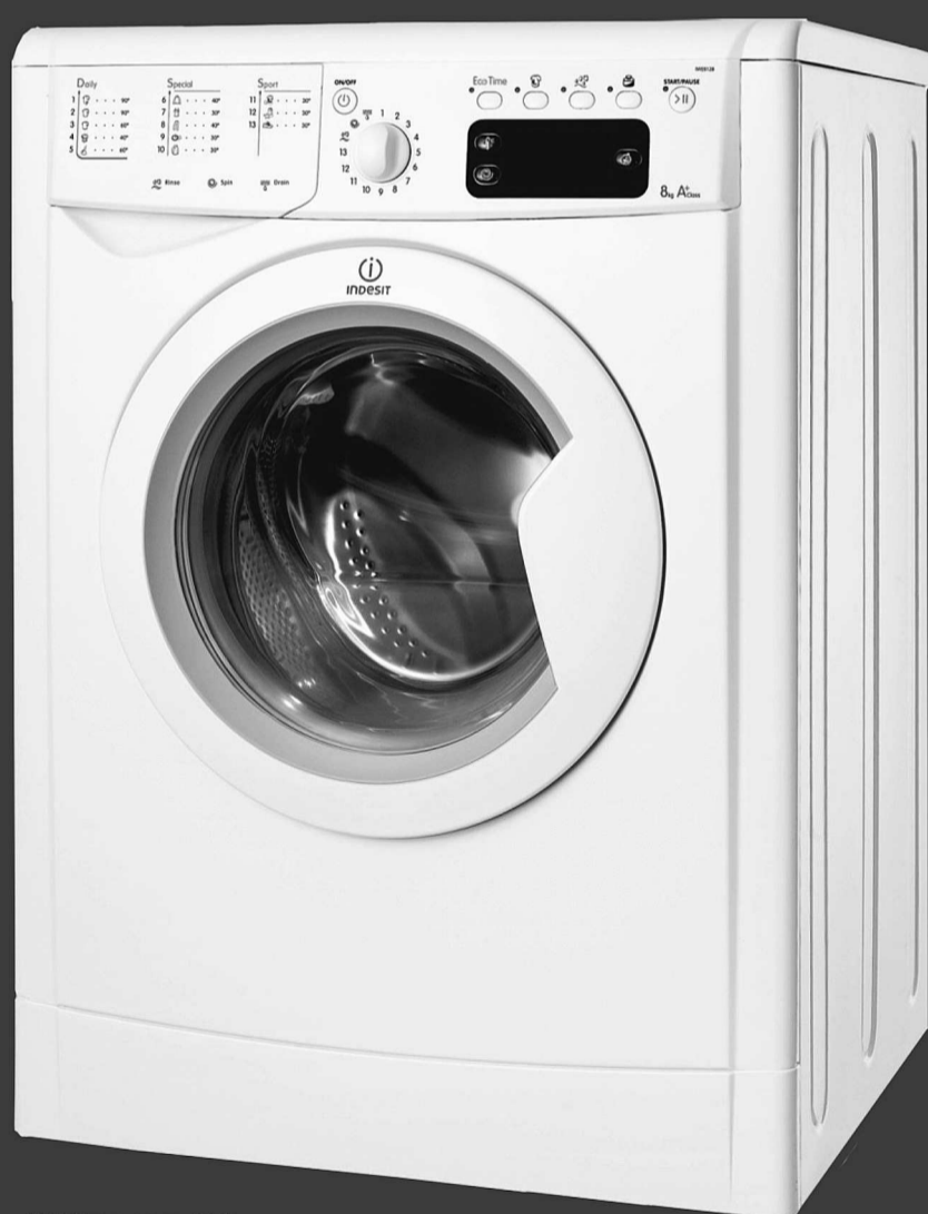
IWSE 6125 CIS

г. Нижняя Тура, ул. Ленина, 108 (р-н центральной вахты)