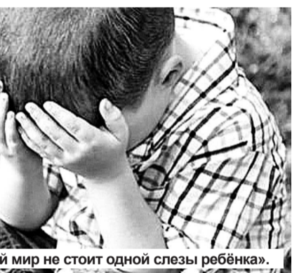
«Целый мир не стоит одной слезы ребёнка».