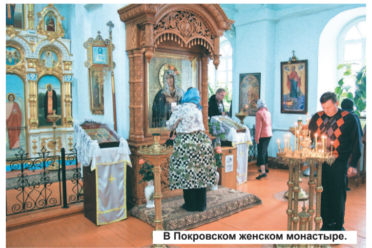
В Покровском женском монастыре.

Помимо развлечений, для многочисленных гостей старинного уральского города была представлена грандиозная духовно-просветительная программа. Можно было посетить краеведческий музей и подробно ознакомиться с историей святого города, посмотреть на предметы старины. В палатке женского Ново-Тихвинского монастыря была выставлена иконопись. Сестры показывали, как создаются рукописные иконы, предлагая гостям взять кисти и сделать маски.