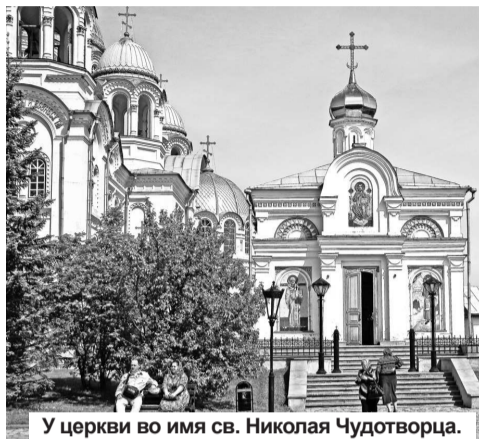
У церкви во имя св. Николая Чудотворца.

Еще в эти дни удивило появление в Верхотурье байкеров из Екатеринбурга, под девизом «Симеоновский крестный