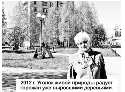
2012 г. Уголок живой природы радует горожан уже выросшими деревьями.