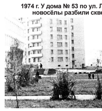
1974 г. У дома № 53 по ул. Ленина новосёлы разбили сквер.