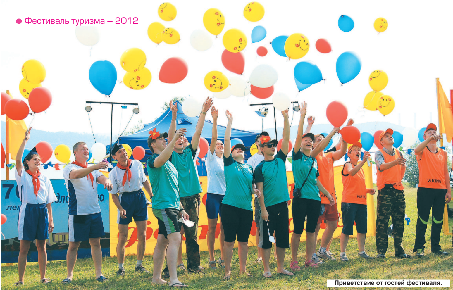
Приветствие от гостей фестиваля.