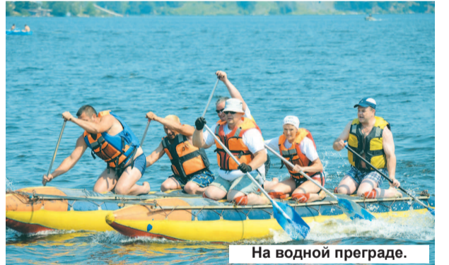
На водной преграде.

В минувшие выходные на территории Нижнетуринского городского округа в районе поляны базы отдыха «Журавлик» состоялся традиционный фестиваль туризма среди работников энергетической отрасли.