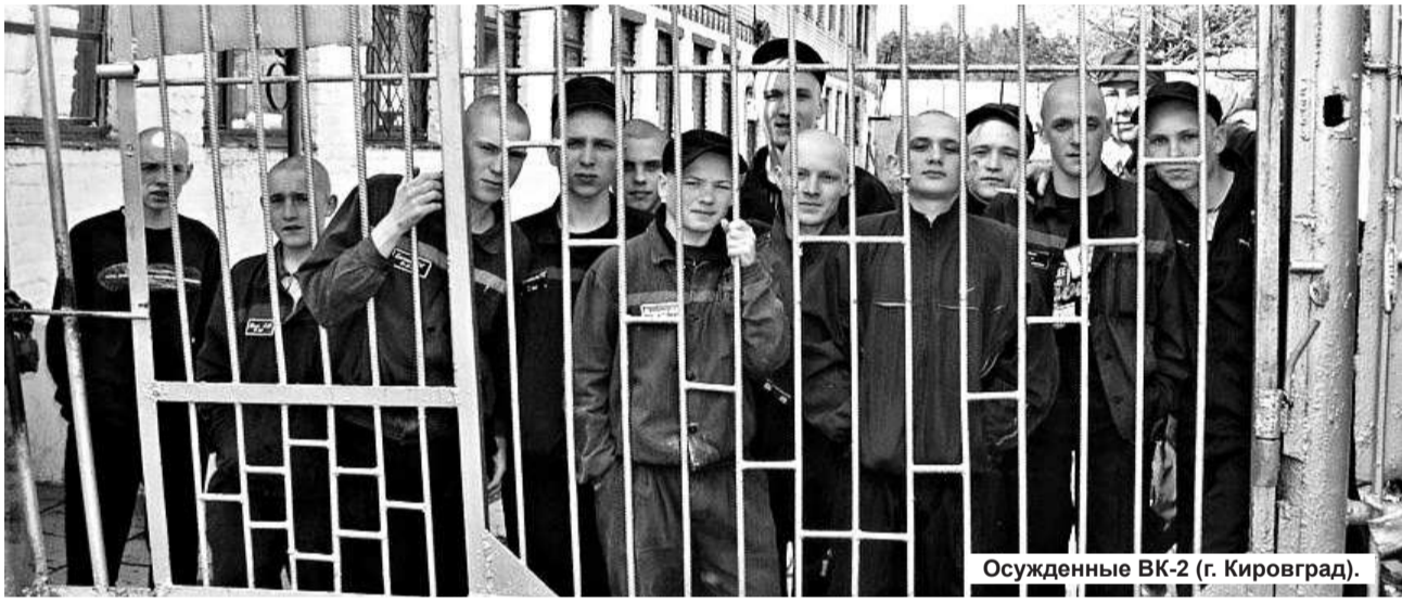
Осужденные ВК-2 (г. Кировград).