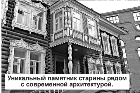
Уникальный памятник старины рядом с современной архитектурой.

кальный факт наличия объекта советской торговли. «На центральной улице В.И. Ленина (кто бы сомневался, что в городе может быть вариант центральной улицы!) повстречалось увидеть действующий автомат по продаже газированной воды, на глазах прохожих его заряжают новой порцией сиропа... И что характерно, никто не портит этот автомат!»