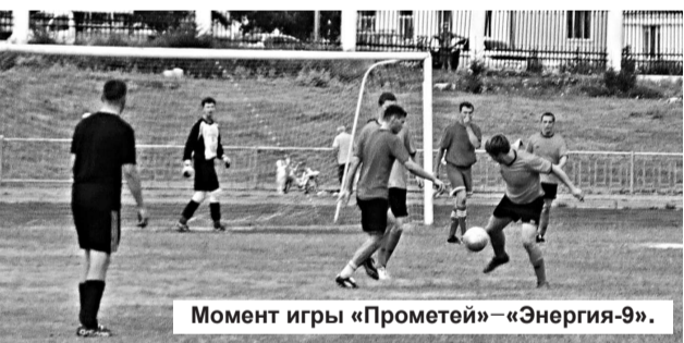
Момент игры «Прометей»–«Энергия-9».