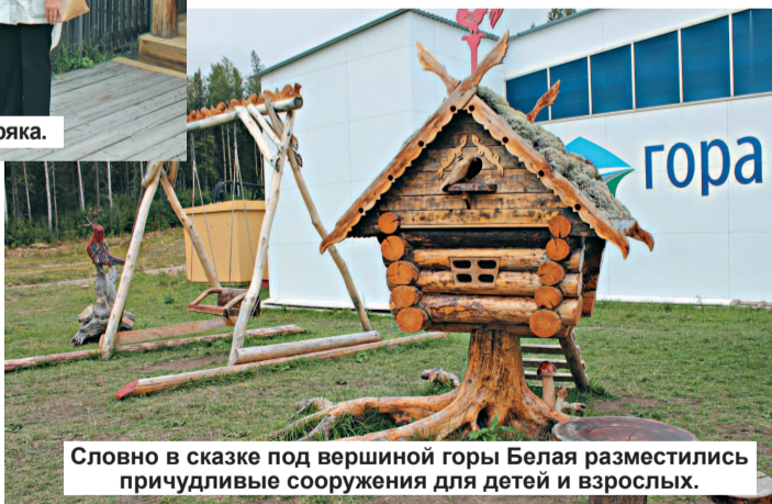
Словно в сказке под вершиной горы Белая разместились причудливые сооружения для детей и взрослых.

вникали, такие как «Кости» для игры в «Бабки», «перочинный нож», «одноклашки». Опытный экскурсовод разъяснила их происхождение. Оказывается, все гениальное, как всегда, просто. Например, дети церковно-приходской школы на свой день рождения приносили горшок каши с маслом, которую ели все по кругу одной ложкой – отсюда и именовали их «одноклашками», дру-