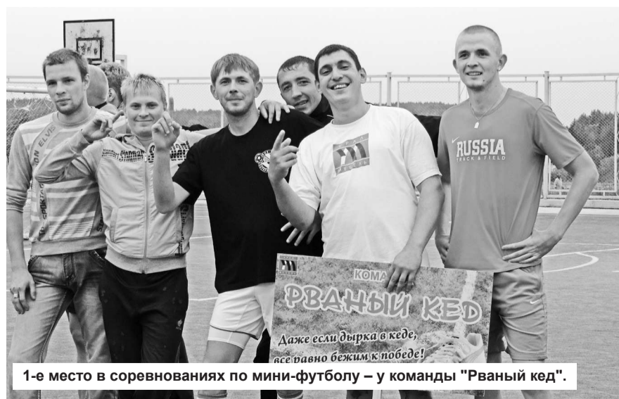
1-е место в соревнованиях по мини-футболу – у команды «Рванный кед».