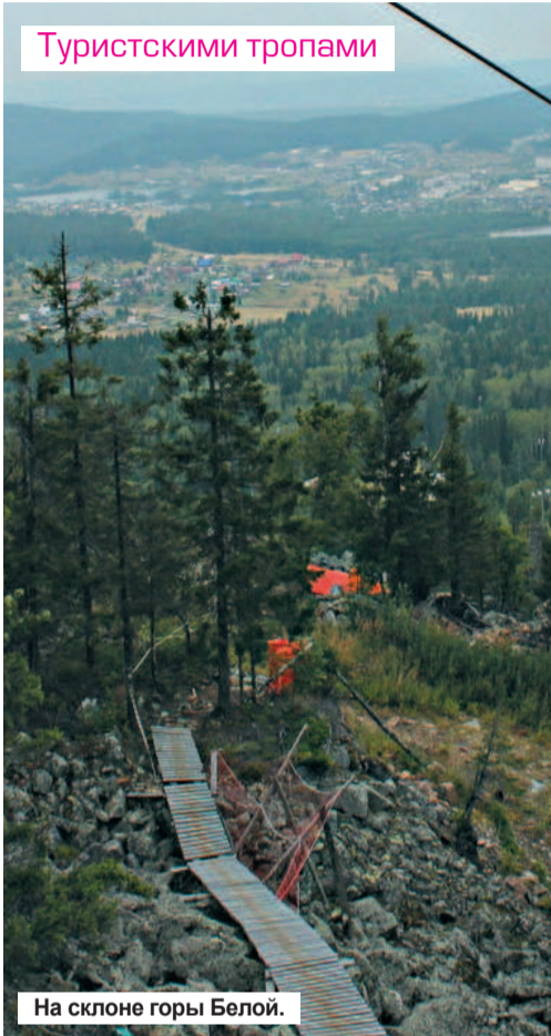
На склоне горы Белой.