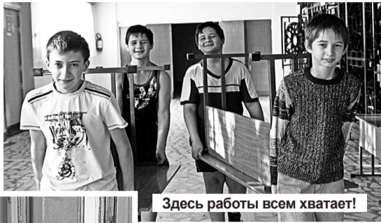
Здесь работы всем хватает!

В общеобразовательных учреждениях Лесного идут последние приготовления к новому учебному году