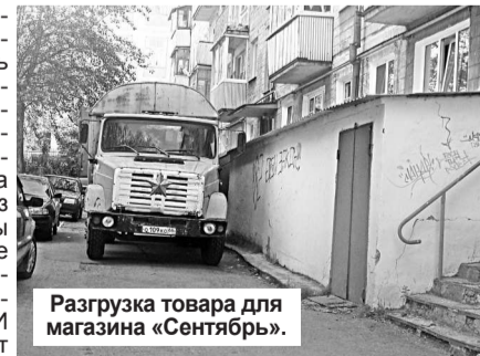
Разгрузка товара для магазина «Сентябрь».