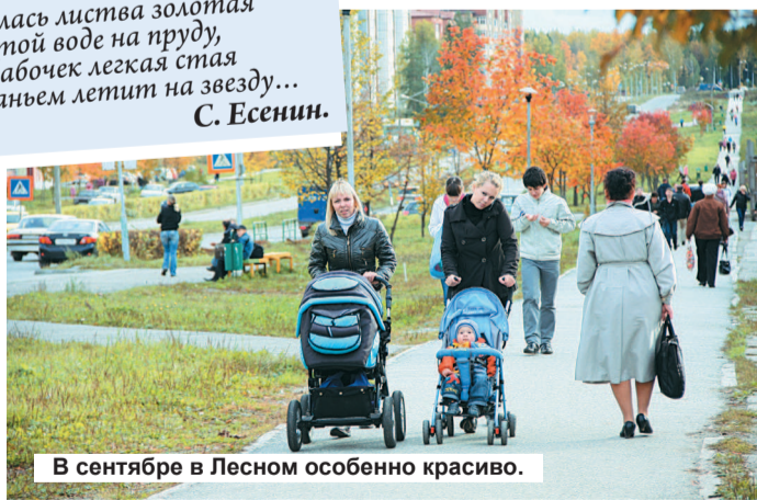
В сентябре в Лесном особенно красиво.

Закружилась листва золотая В розоватой воде на пруду, Словно бабочек легкая стая С замираньем летит на звезду... С. Есенин.