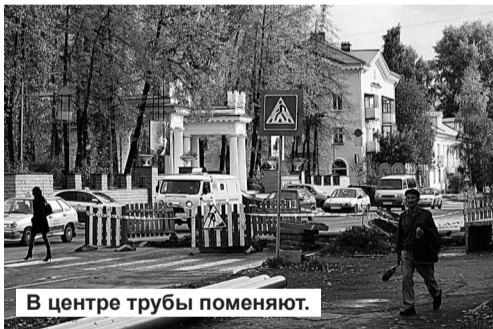
В центре трубы поменяют.

ставленных на текущий. Сегодня общая изношенность теплосетей составляет более 60%. Поэтому, как и в прошлые годы, основной проблемой является их реконструкция. Перед тем как начать ремонтную кампанию, в мае и августе мы проводили ежегодные испытания на тепловые и гидравлические потери с отключением горячего водоснабжения у потребителей. Финальные работы по устранению выявленных локальных порывов на всей территории городского округа должны быть закончены к 15 сентября. Завершается плановая замена двух труб (800 м), пришедших в негодность, по ул. Ленина в районе центра. В отличие от некоторых областных городов, где практикуют опрессовку один раз в год, мы не рискуем. На мой взгляд, к зиме надо готовиться основательно и ориентироваться на самые суровые погодные условия. Работать в зимних условиях крайне сложно. Чем больше прорек устраним, тем ниже вероятность возникновения аварийных ситуаций. Что касается систем электро- и газоснабжения, то они, можно сказать, в порядке.