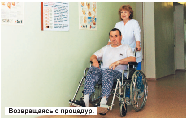
Возвращаясь с процедур.

неправильное питание и низкие физические нагрузки. Люди потребляют высококалорийную пищу, перекусывают на ходу, мало двигаются. В итоге – нарушение жирового обмена и атеросклеротическое поражение сосудов сердца. В-четвертых, умственные и психологические нагрузки, связанные с напряженностью труда, социальной ответственностью. «В отделение чаще госпитализируются больные с осложненными гипертоническими кризами, нарушениями ритма сердца, инфарктами миокарда. Последний диагноз все чаще ставится больным в возрасте 40-49 лет.