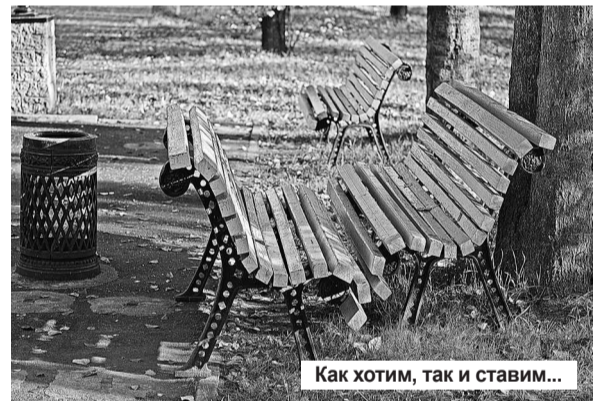
Как хотим, так и ставим...