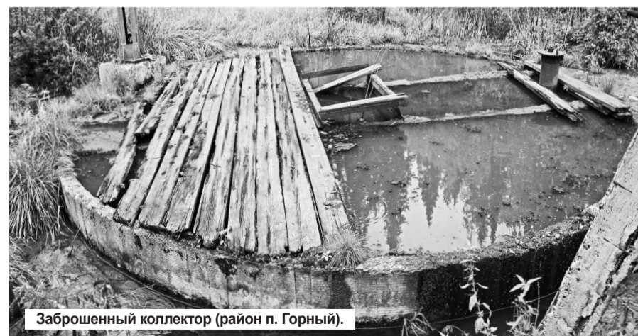
Заброшенный коллектор (район п. Горный).