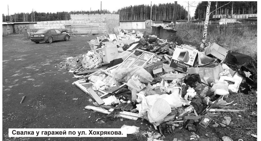
Свалка у гаражей по ул. Хохрякова.

(«Экстрим по-лесновски», «Радар» № 42 от 18.10.2012 г.)