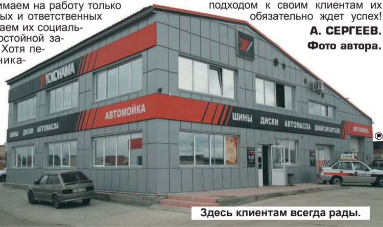
Здесь клиентам всегда рады.