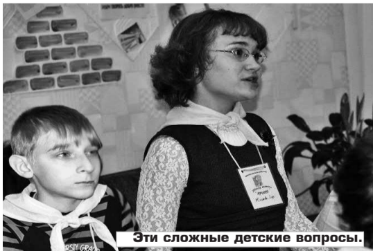
Эти сложные детские вопросы.

семицветик». Виктор Васильевич признался, что это – один из его любимых цветов, это цвет православной церкви! Он рассказал, что мечтает, что когда будет построен, наконец, наш городской храм, над которым уже вот-вот вознесется второй купол, он оденется именно в бело-синие одежды!