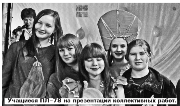
Учащиеся ПЛ-78 на презентации коллективных работ.

Совместно с преподавателями и мастерами производственного обучения некоторые конкурсанты выходили к зрителям в русских народных костюмах: задорно пели, звонко читали стихи о корнеплодах, угощали гостей вареньем и мастерски отгадывали загадки, получая в презент те самые дары осени. В завершении праздника никто не остался без награды. Ребята получи-