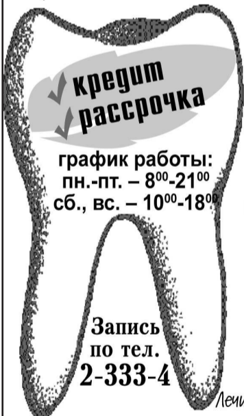
график работы: пн.-пт. – 8 00 -21 00 сб., вс. – 10 00 -18 00