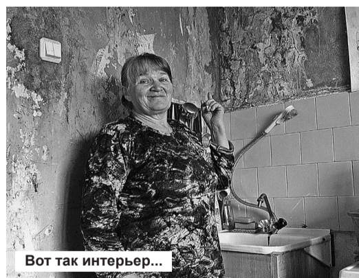
Вот так интерьер...

чения и выдачу рекомендаций по ее дальнейшей эксплуатации уже направлено письмо. После получения указанного заключения и решения вопроса с проведением ремонта кровли, гражданам выполнят ремонт затопленных жилых помещений.