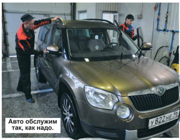
Авто обслужим так, как надо.

Благодаря прогрессу автотранспорт прочно вошел в нашу жизнь, а профессия водителя стала одной из самых востребованных