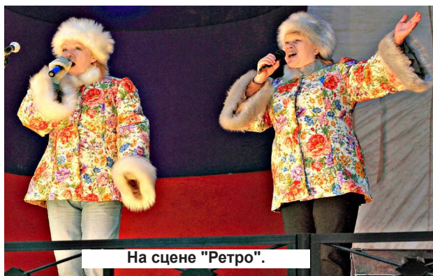
На сцене «Ретро».

Затем началась праздничная программа. Особенностью нынешней стало участие в ней поединщиков нового культурного проекта «SUPER STAR». Он стартовал в сентябре, мы об этом писали, в октябре состоялась вторая битва, сейчас участники проекта – две коман-