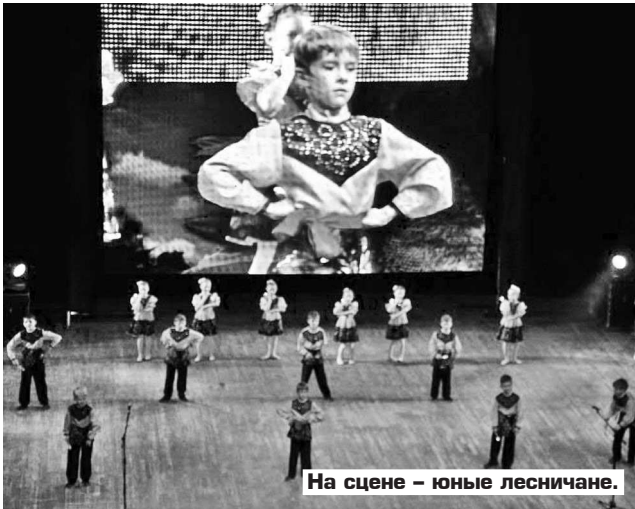
На сцене – юные лесничане.

Этот конкурс проходит при поддержке Министерства культуры РФ в рамках Федеральной целевой программы «Культура России (2012-2018 годы)». В конкурсе принимали участие коллективы и исполнители из 37 городов 14 субъектов РФ – Московской, Свердловской, Самарской, Тюменской, Кировской, Кемеровской, Томской, Оренбургской, Челябинской областей, Пермского и Алтайского краев, Ямало-ненецкого автономного округа, Республик Башкортостан, Коми, Казахстан. Общее количество конкурсантов – 700.