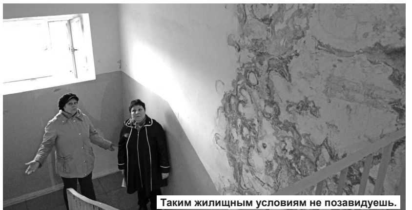
Таким жилищным условиям не позавидуешь.

– В 2012 г. во время проведения двух гидравлических испытаний (опрессовок) было выявлено: в первом случае – около