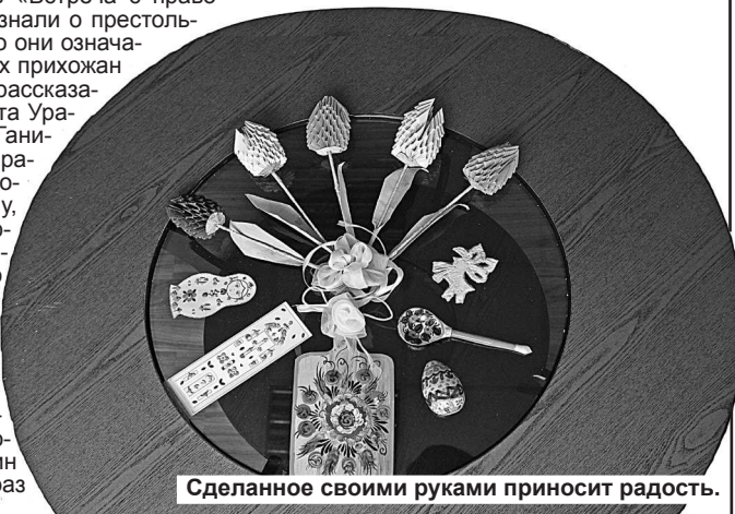
Сделанное своими руками приносит радость.

P.S. Видели бы вы, уважаемые горожане, нас во время занятий, наши одухотворенные, сосредоточенные лица. И каждый что-то умеет делать. Да и возвращение ремесел – дело хорошее, оно приносит добрые плоды. Во все времена человек украшал свое жилище, как умел. Да и что-то, сделанное своими руками, приносит радость тебе и тем, кому ты даришь свое изделие. Вот это и называется жизнь!