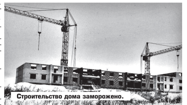
Строительство дома заморожено.

ШОК. ГОРЕ и СЛЕЗЫ. Такими словами описывают собственное незавидное положение обманутые дольщики на своем форуме ( http://forum.lesnoy.tv/showthread.php?t=953 ). Есть молодые семьи с маленькими детьми, люди среднего возраста. Пожилых, слава Богу, нет, а то не пережили бы, наверно. Чтобы вносить кредитные средства, некоторым пришлось продать свои квартиры. Сейчас мотаются по съемным. А у людей были светлые планы – получить новое жилье! Вместо этого – однушка далеко не первой свежести, взятая в аренду. Вообще стоит понимать, что, когда решается квартирный вопрос, он непременно затрагивает большое число родственников, с которыми вместе планируешь, решаешь: разъехаться, поменаться, отделить-