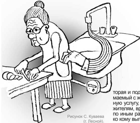
Рисунок С. Куваева (г. Лесной).

“Вся власть исходит от народа. И никогда не возвращается.”