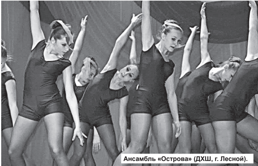
Ансамбль «Острова» (ДХШ, г. Лесной).