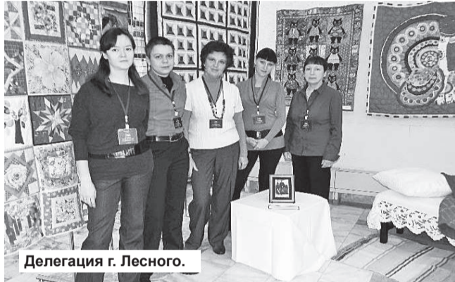
Делегация г. Лесного.

По итогам фестиваля коллективу нашего МВК была вручена Почетная грамота за проект «Женское рукоделие для дома»