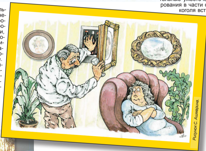
Рисунк С. Ашмарина

СЕГОДНЯ ПЬЯНСТВО – национальная беда, которой до сих пор почему-то негласно продолжают потакать. В нашем городе нет ни одного магазина, где бы не продавались спиртные напитки, в частности, пиво. Даже в обычной булочной имеется холодильничек с горячительным. В такой ситуации не удивительно, что население начинает быстрее стареть, а алкоголизм молодеет. «Мы напрочь погрязли в алкоголе. Его продают на каждом шагу. Один Коммунистический проспект чего стоит!.. Только по пути от сквера им. Гагарина до Обелиска можно насчитать как минимум восемь точек, где продают спиртосодержащую продукцию, – возмущается молодая мама. – И это в районе одной из главных культурно-парковых зон Лесного. О какой тогда борьбе с алкоголизмом может идти речь, непонятно». С подобно рода доводами граждан трудно не согласиться.