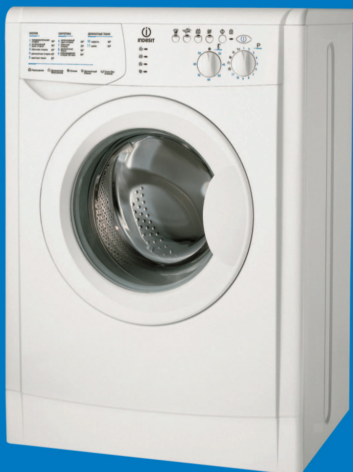
WIUN 105 (CSI)