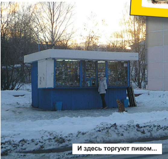
И здесь торгуют пивом...