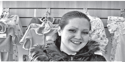
«О компании «УРА!» и ее продукции говорят много хорошего, пришла и увидишься».

Компания планирует «расти» вместе с потребителями – запустить линейку продукции на детей постарше. В этом году решили освоить новую нишу – уже принимает коллективные заявки на пошив школьной формы. Причем могут предложить выполнение даже с разработкой дизайна модели. Для школьников ткани закупают на одной из лучших отечественных фабрик. Какой именно, не сказали – коммерческая тайна, отмечу лишь, что там берет ткани для своих коллекций Валентин Юдашкин.