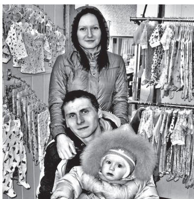
«Мы пришли в магазин фирмы «УРА» впервые (по совету знакомых) и остались довольными».