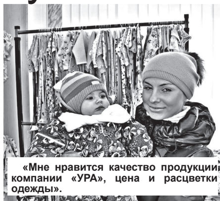
«Мне нравится качество продукции компании «УРА», цена и расцветки одежды».

имела, с какой стороны к швейной машинке подходить (смеется). Понимали только, что такое производство очень нужно – на отечественном рынке засилье китайской продукции. А где ее делать, из чего – кто знает? Ведь молодых мам, прежде всего, заботит здоровье их детей.