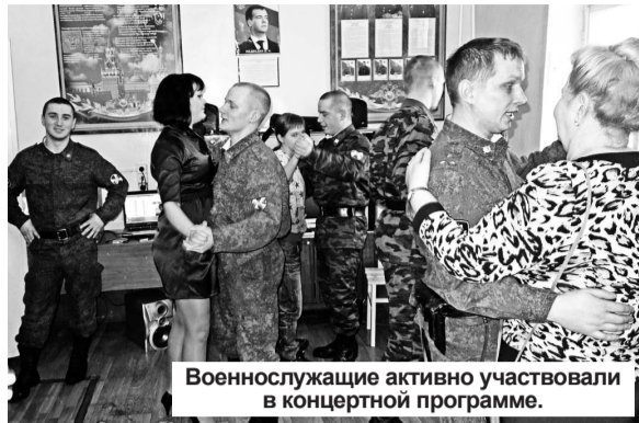
Военнослужащие активно участвовали в концертной программе.

Кто служил, тот поймет, как дороги солдату внимание и забота. Об этом никогда не забывает Комитет солдатских матерей города. Вот и в воскресный день 5 февраля заботливые мамы и учащиеся ГБОУ НПО СО «Профессиональный лицей №78 им. О.В. Терёшкина» начали традиционные выезды на заставы войсковых частей с программой, посвященной Дню защитника Отечества. Хотя до 23 февраля еще 18 дней, но месячник защитника Отечества уже идет по всей стране.