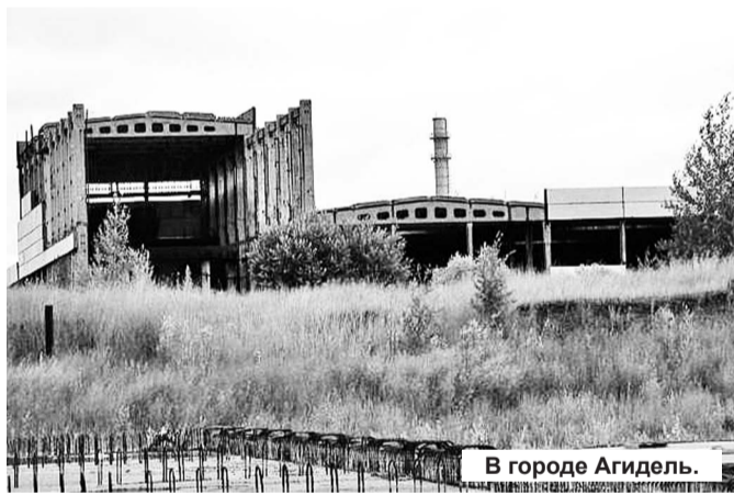
В городе Агидель.

Как это будет? Не нужно ходить далеко за примером. Башкирский сценарий... После того как в угоду сиюминутным настроениям атомщиков выдавили из города Агидель, история его превратилась в трагедию тысяч людей. Двадцать тысяч людей, высококлассных специалистов, остались не у дел. Кто-то уехал, а кто-то, не веря в то, что произошло, остался... В городе появилась страшнейшая безработица, даже официальные цифры статистики были рекорды, люди пытались скрыться от реальности, отгородившись стеной бутылок. Город заглох. Заглох по-черному, как мужик в неутешном горе. Не было надежд, перспектив и денег. Многомесячные задержки по выплате зарплат, бартерные выплаты, когда вме-