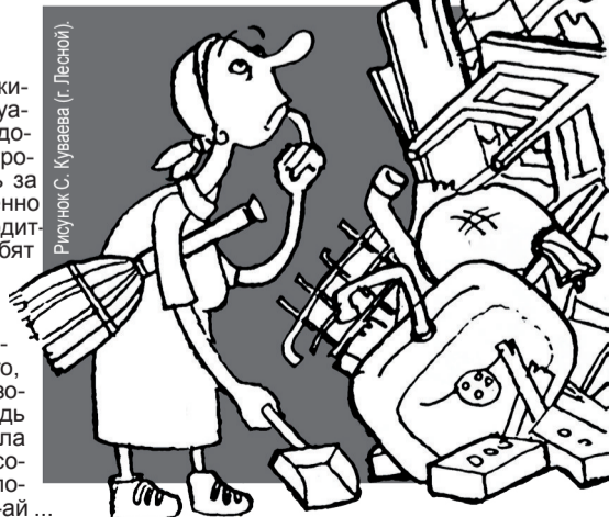
Рисунок С. Куяева (г. Лесной)