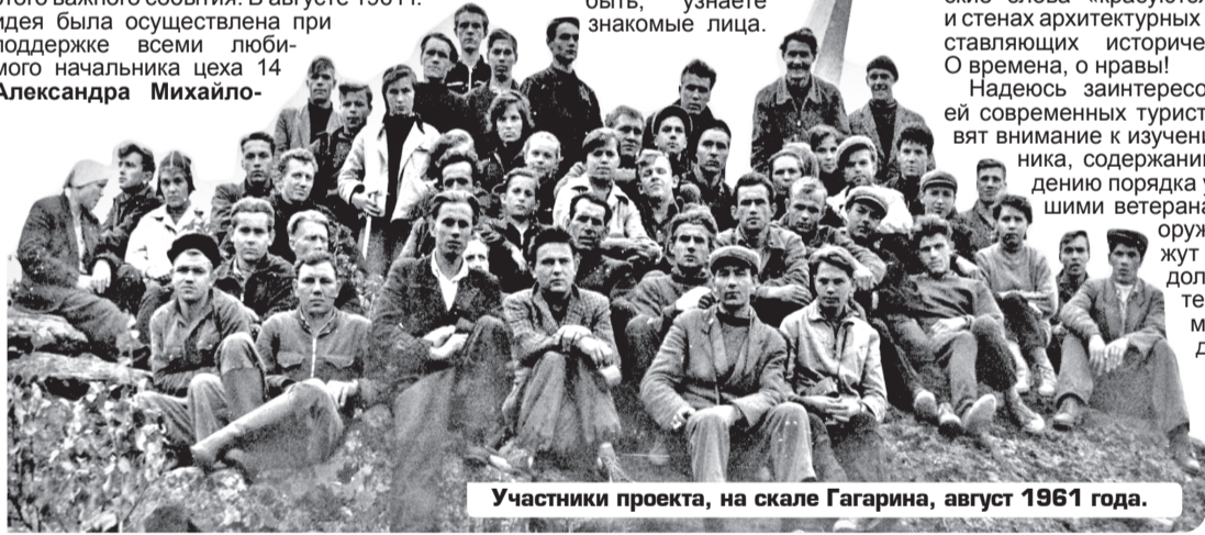
Участники проекта, на скале Гагарина, август 1961 года.

Вспомните в лица участников восхождения, может быть, узнаете знакомые лица.