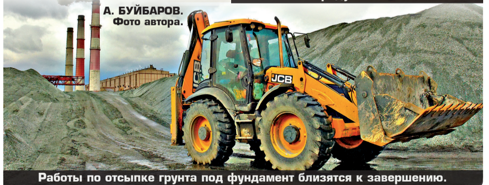
Работы по отсыпке грунта под фундамент близятся к завершению.