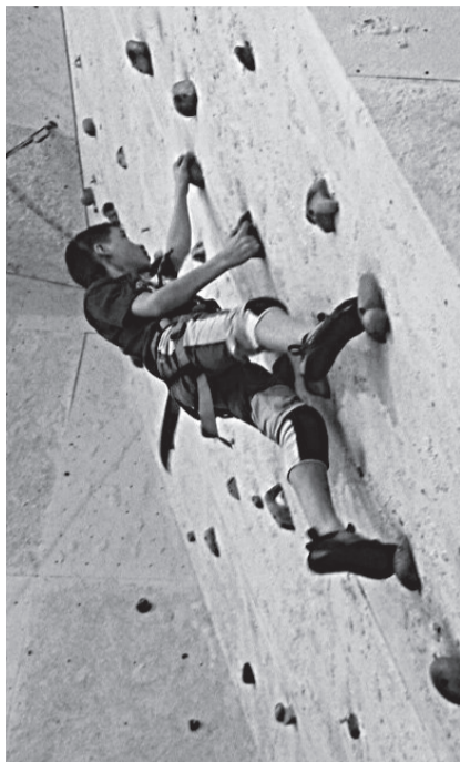
Как на настоящих скалах.

За это время спортивное скалолазание среди жителей и гостей поселка не потеряло своей популярности. Чтобы полагаться по искусственному рельефу смельчакам из Нижней Туры, Лесного, Качканара не лень преодолевать десятки километров каждую неделю. И делают они это не только из-за любви к экстриму, но еще и потому, что в Свердловской области скалодрома есть только в Красноуральске, Екатеринбург, Нижнем Тагиле и на Ис. Приятно осознавать, что по уровню оснащения и качеству подготовки спортсменов в данном случае поселок не уступает крупным городам.