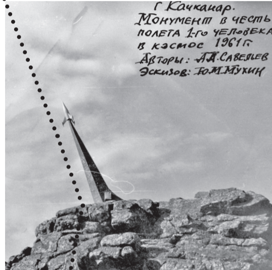
Памятник, установленный на горе Качканар ветеранами комбината ЭХП.