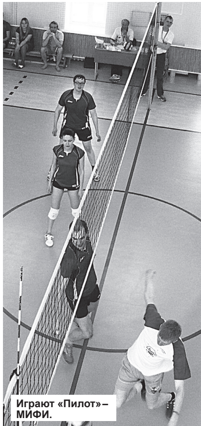
Играют «Пилот» — МИФИ.