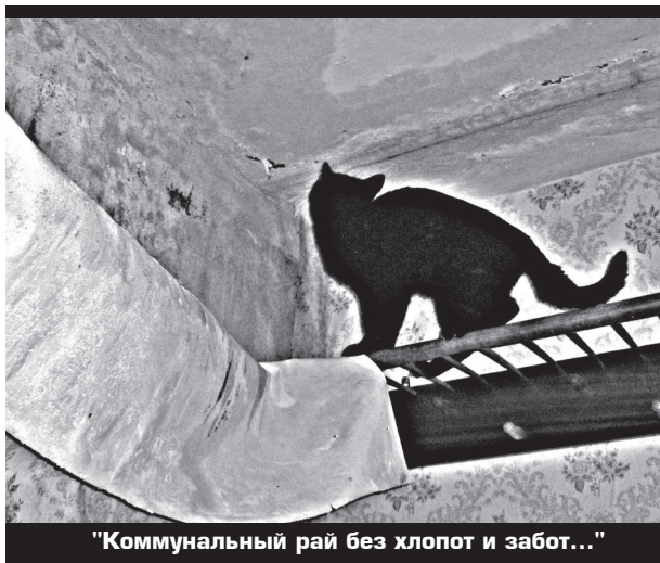
«Коммунальный рай без хлопот и забот...»

Куда уходят деньги, в какую сторону? И где найти нам средства, чтоб залатать дыру? За дом исправно платим, скудеет наш кошелек. Со счета деньги тащат все кому не лень!.. (Народное словотворчество)