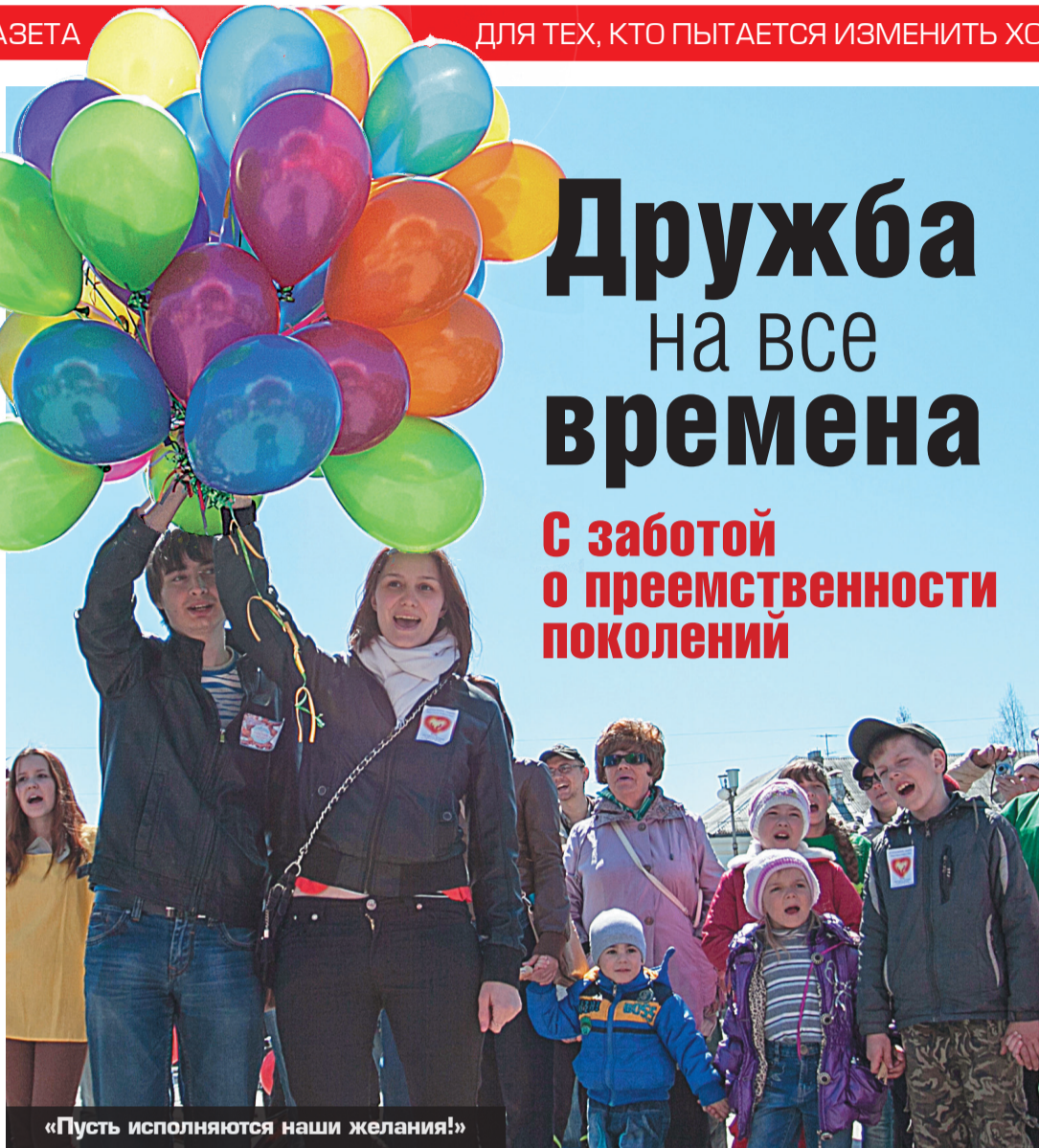
«Пусть исполняются наши желания!»

По традиции в этот день успешно была проведена «Акция очень добрых дел». Каждый желающий смог купить на площади СКДЦ «Современник» канцелярские товары, игрушки, сувениры и положить их в специально подготовленные коробки с надписью «Подарки детям». Все собранные вещи будут переданы детям, оказавшимся в трудной жизненной ситуации и детям с ограниченными возможностями здоровья. Все участники акции получили памятную наклейку и «Ленту желаний».