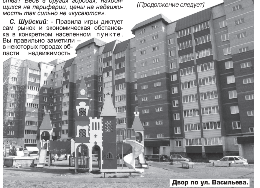
Двор по ул. Васильева.