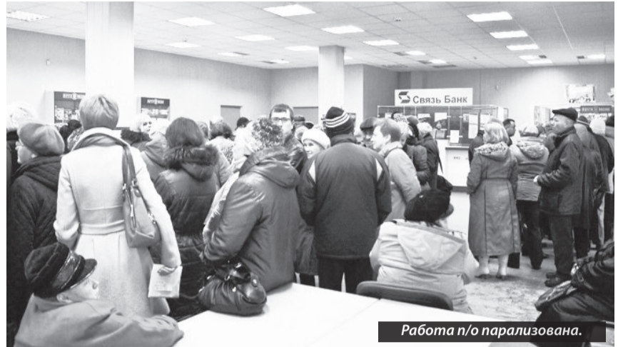
Работа п/о парализована.

ководства. Благодатной средой для разгулявшегося бюрократизма стало внедрение на предприятии так называемой системы менеджмента качества (СМК), которая фактически ввергла предприятие в хаос и трату драгоценного времени. Те, кто знает работу почты изнутри, не перестают твердить о том, что теория СМК обернулась для его подразделений не эффективными мерами, а исключительно расходом тонн бумаги. Зато ради успешного функционирования почты в составе аппарата управления ФГУП была создана целая Дирекция по управлению качеством, переименованная далее в Дирекцию по организации производственных процессов, «рулящая» подразделениями в территориальных УФПС. С завидной периодичностью почтовое начальство «осластливливает» подчиненных добрым десятком изменений в нормативных документах, касающихся СМК. Бумажным «качеством» забиты целые шкафы в отделениях связи! К сожалению, при таком похвальном рвении о теории качества главные «Печкины» страны так и не удосужились позаботиться об упорядочении сугубо почтовой нормативной базы, определяющей технологию работы. Под лозунгом повышения доходности предприятия они обременяют сотрудников отделений связи оказанием многочисленных непрофильных услуг – вплоть до продажи промтоваров, книг и прочих мелочей, не задумываясь над тем, что в условиях хронического дефицита кадров предоставление этих услуг напрямую вредит основной функции почты – четкой и быстрой доставке, оперативному обслуживанию клиентов. В свою очередь кадровый го-