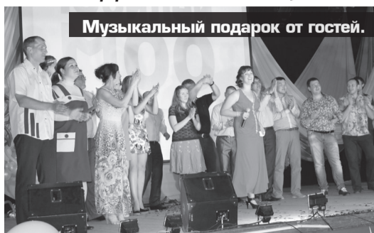
Музыкальный подарок от гостей.

Интересные идеи не иссякают у членов Совета никогда. Они с легкостью увлекают молодежь своими творческими мероприятиями. А юбилейное торжество – своеобразный итог достижений и побед. Мудрецы говорят: «То, каким курсом вы идете – гораздо важнее, чем ваша скорость!». Коли растут ряды МОО, значит, верный избран курс. На вечере единомышленники («молодежки» блистали изобретательностью, мастерством, остроумием, вставив в праздничное шоу множество любопытных находок. Это и кавказские «приколы», искрометный юмор, танцы, песни и юмористический фильм о себе, комбинате. Удивлена публика была и массовыми танцевальными постановками в исполнении групп девчат и парней. Зрители восторженно приняли оба варианта, не сумев отдать предпочтение кому-то одному из них. Музыкальные подарки молодежи комбината адресовали в том числе и самодельные артисты из «Юности». Не скудеет самодельность