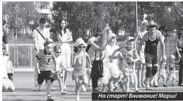
На старт! Внимание! Марш!

В минувшую субботу сотрудники ОМВД России по городскому округу «Город Лесной» отметили 64-ю годовщину образования своего отдела.