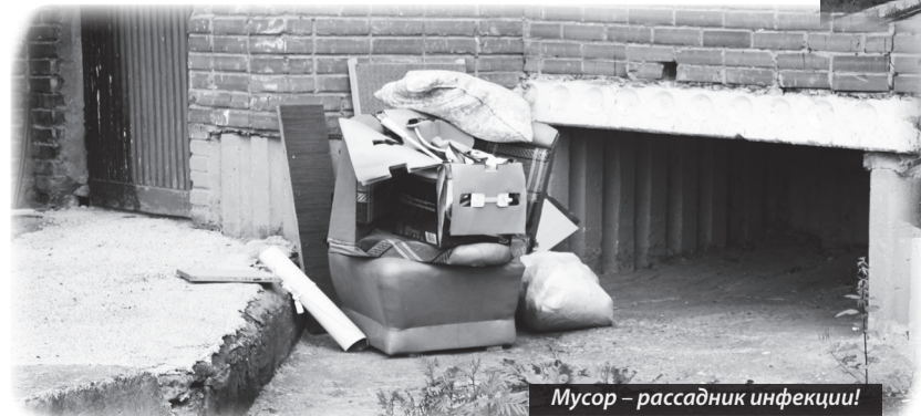
Мусор – рассадник инфекции!

Контраст на тему «Что такое хорошо и что такое плохо» на фотографиях очевиден. Полубуйтесь и сделайте выводы!