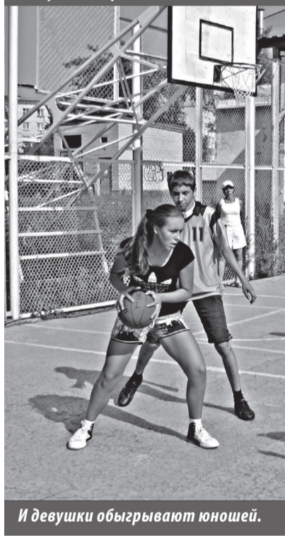
И девушки обыгрывают юношей.