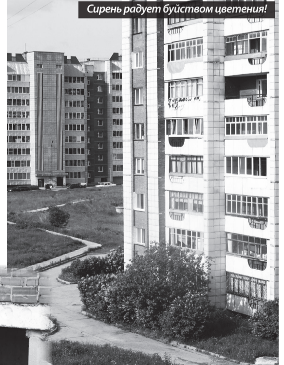
Сирень радуется буйством цветения!

К сожалению, не везде горожане могут наблюдать истинную природную красоту. На некоторых улицах так ничем и не заменили спиленные тополя и вязы, сквер им. Гагарина продолжает ждать своей «реставрации» – там много больных деревьев, нуждающихся в помощи человека. Конечно, не каждому дано призвание устраивать цветники во дворах. Как и в любом деле, тут требуется основательность и профессионализм. Но следить за чистотой и не оставлять мусор после себя – наша прямая обязанность! Давайте заботиться о своем здоровье, дышать чистым воздухом, не загрязненным бытовым мусором, окурками, пищевыми отходами.