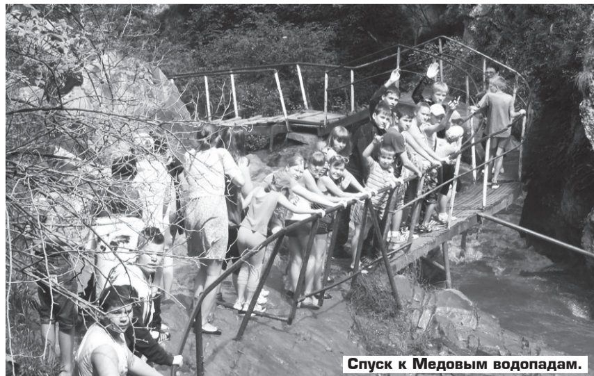
Спуск к Медовым водопадам.

Н. МУХИНА, председатель информационной комиссии ПК-391.