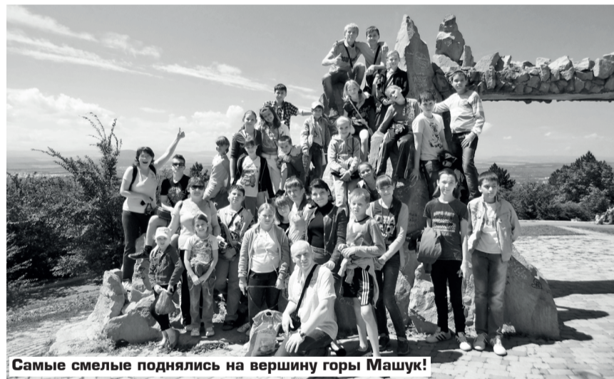
Самые смелые поднялись на вершину горы Машук!