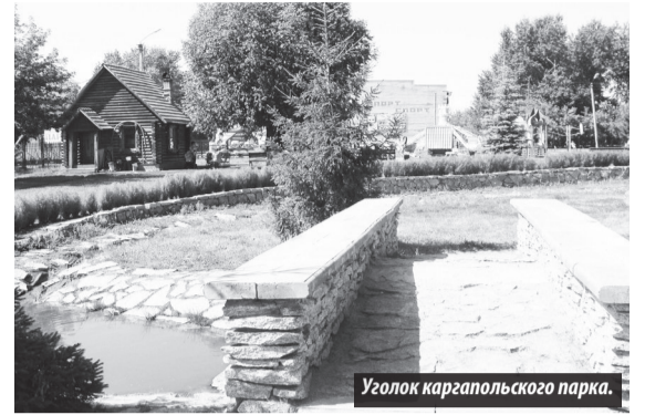
Уголок каргапольского парка.

Теперь вернёмся к Лесному. Видимо, подобное непосильно для нашего атомного города. Несмотря на кажущийся внешний порядок, все аттракционы у нас буквально скучены на небольшом участке возле автодрома. На этом «пятячке» проводится и большинство массовых мероприятий. Уединиться и посидеть особо негде. Непонятно с какой целью вход-выход обозначен коваными металлическими воротами, которые, в отсутствие ограды, обойти можно с любой стороны. Кстати, попутно риску высказать мнение, что засилье в городе однотипных металлических конструкций вскоре может отрицательно сказаться на облике Лесного. (Вспомните недовольство москвичей многочисленными творениями З. Церетели).