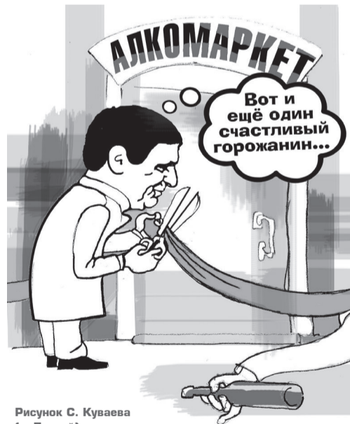
Рисунок С. Куваева (г. Лесной).

проходить адаптация бывших воспитанников школы-интерната в условиях 74-й, какие адекватные меры в помощь малоимущим и многодетным семьям разработаны.