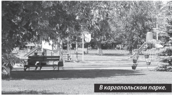
В каргапольском парке.

Почти ежегодно бываю я в Курганской области. В экономическом отношении регион этот — слабый, если не сказать отсталый. Население малочисленно, занято преимущественно в сельском хозяйстве. Так вот, есть в Курганской области (по автодороге Шадринск - Курган) рабочий посёлок Карга-