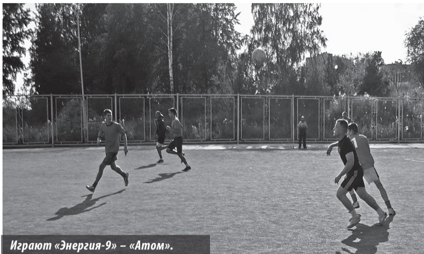
Играют «Энергия-9» – «Атом».

Открытое первенство г. Лесного. Мини-стадион СДЮСШОР «Факел». 12-16.08.2013