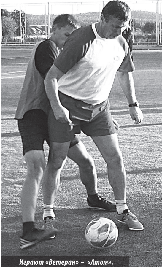
Играют «Ветеран» – «Атом».

Открытое первенство г. Лесного. Мини-стадион СДЮСШОР «Факел». 19-23.08.2013