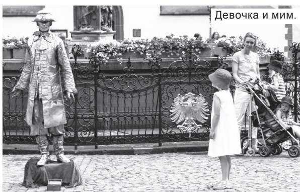
Девочка и мим.