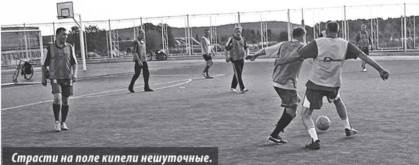
Страсти на поле кипели нешуточные.