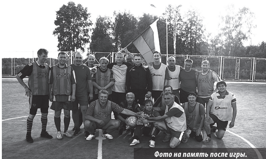
Фото на память после игры.