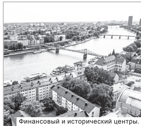
Финансовый и исторический центры.