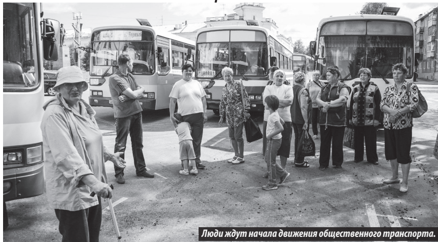
Люди ждут начала движения общественного транспорта.

Чем недовольны автотранспортники и пассажиры Лесного