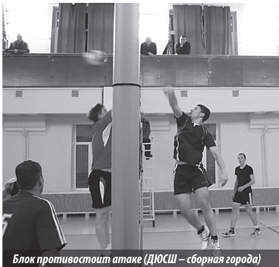
Блок противостоит атаке (ДЮСШ – сборная города)