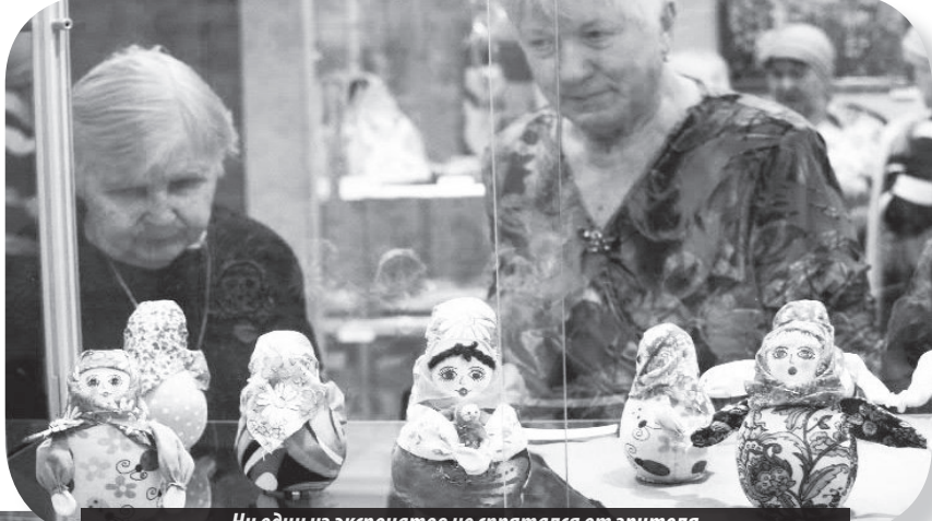
Ни один из экспонатов не спрятался от зрителя