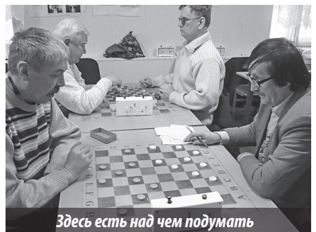
Здесь есть над чем подумать

таком раскладе с большой долей вероятности поклонники шашек могут увидеть интереснейшую концовку турнира. Но, как выяснилось, спортсменов волнуют не только турнирные проблемы. С нового года шахматисты и шашкисты из-за высокой арендной платы лишатся своих помещений и займут одну из комнат во Дворце спорта «Факел». Нам остается только по-доброму позавидовать коллегам из Нижнего Тагила и Новоуральска, где условия для проведения соревнований, наоборот, существенно улучшились.