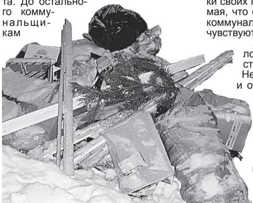
Такие кучи и в центре города – не редкость.

КАК ВО ДВОРАХ нового района, так и в старой части города нередко можно встретить груды мусора возле подъездов. Они продолжают лежать неделями, прежде чем будут убраны сотрудниками коммунальных служб. Чего здесь только нет: коробки, банки, старое тряпье, нерабочие холодильники и унитазы – все это народное богатство изо дня в день продолжает «радовать» глаз жильцов. По всей видимости, последняя общегородская уборка придомовых территорий была произведена еще в начале января – после новогодних праздников или того раньше. На дворе – середина февраля, а горы хлама сотрудники ЖКХ продолжают сознательно игнорировать. Приедут, вывалят мусор из контейнеров, и на этом basta. До остального коммунальщикам