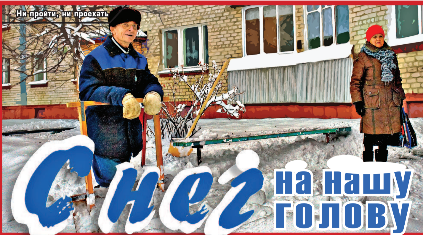
Ни пройти, ни проехать