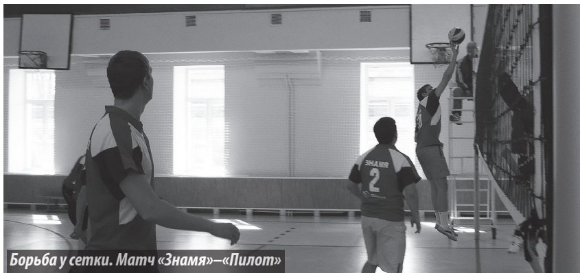
Борьба у сетки. Матч «Знамя»-«Пилот»

С интересом ожидалась игра «Энергетик» - «Конструктор», но «энергетики» на игру не явились. В итоге им зачтено последнее место в группе А (и одинад-