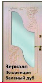
Зеркало Флоренция беленый дуб