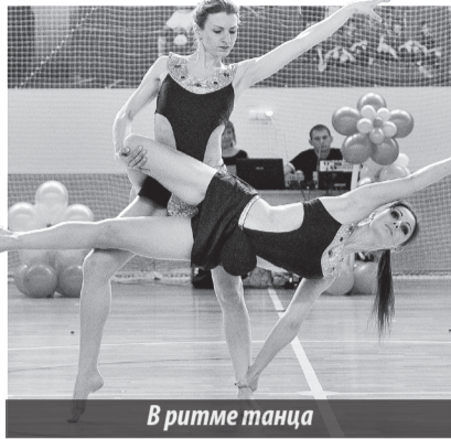
В ритме танца

Цель фестиваля – не показать что-то сверхсложное, а представить до-