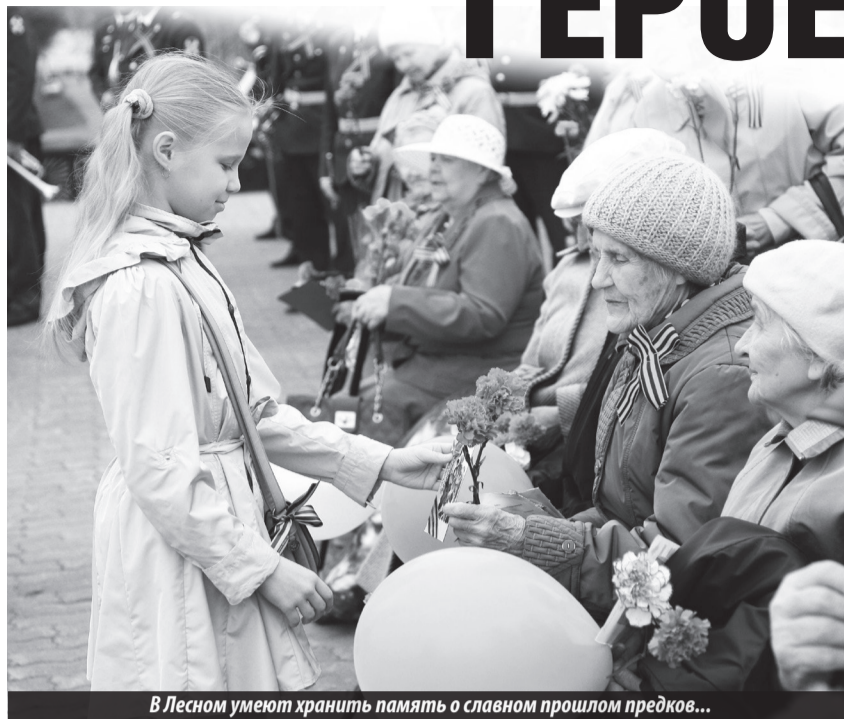
В Лесном умеют хранить память о славном прошлом предков...

В этом году торжественная встреча ветеранов Великой Отечественной войны и тружеников тыла из наших городов-побратимов проходила в городе Лесном, как всегда, в преддверии Дня Победы.