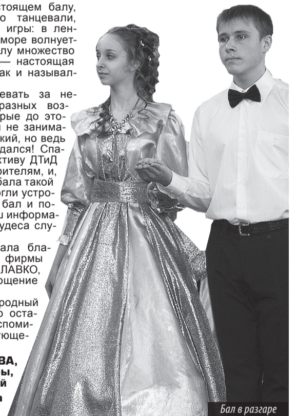
Бал в разгаре

Татьяна САИТОВА, редактор отдела культуры, г. Лесной