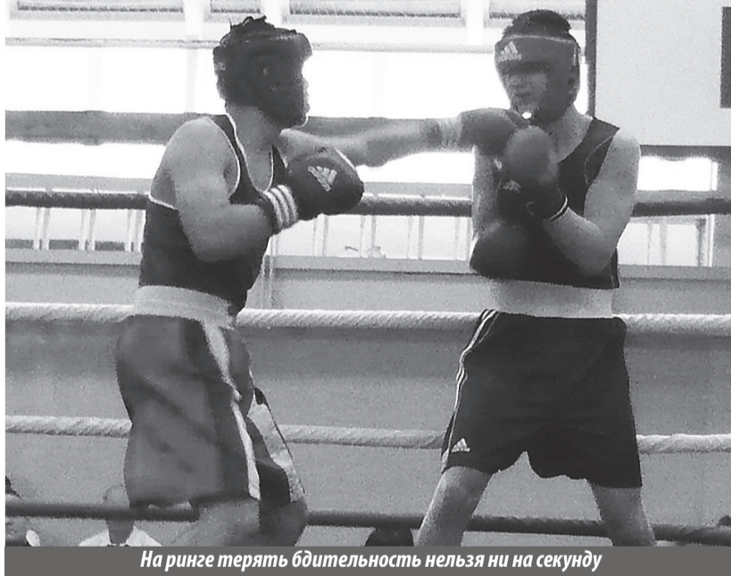
На ринге терять бдительность нельзя ни на секунду

Открытое первенство г. Лесного, посвященное Дню Великой Победы. Лесной. Зал ДЮСШ УО. 03-04.05.2014.