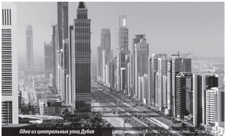
Одна из центральных улиц Дубая

Заслуживает внимания и местный ипподром Над-аль-Шеба. Беговые дорожки и трибуны поддерживаются в безукоризненном состоянии. Скачки проводятся с октября по апрель с неизменным участием лучших жокеев Австралии, Европы и США. Самый высокий отель в мире выстроен специально, чтобы стать символом