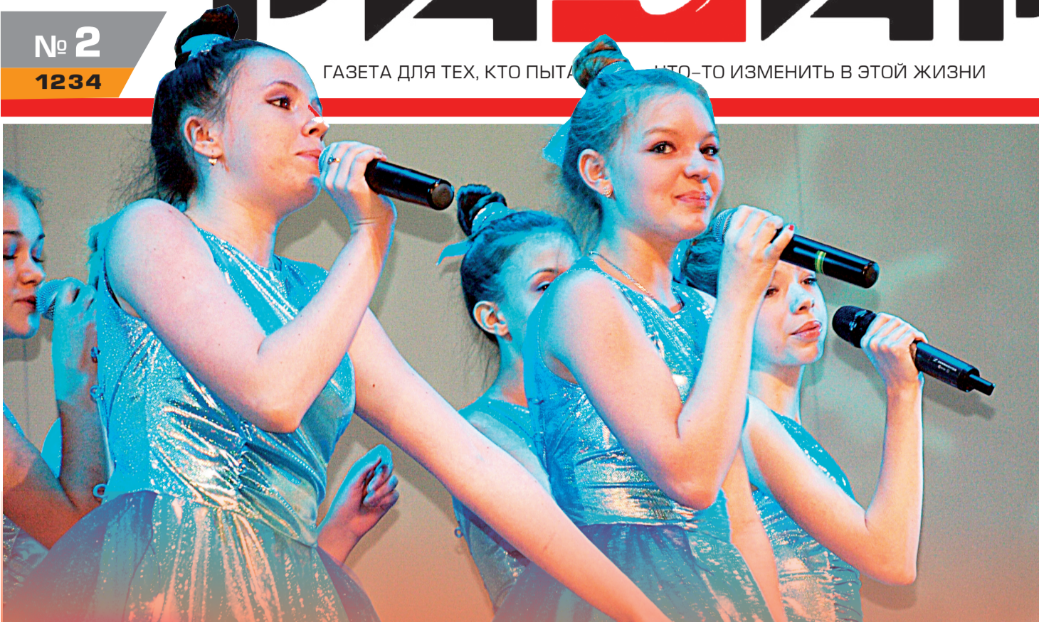
Таланты Детской музыкальной школы