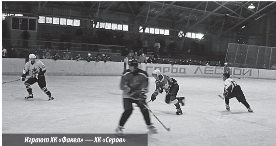
Играют ХК «Факел» — ХК «Серв»