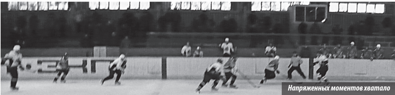
Напряженных моментов хватало