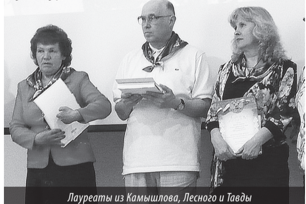
Лауреаты из Камышлова, Лесного и Тавды

отметили, над чем им стоит дополнительно поработать, чтобы «Весняночка» набирала обороты и стала традиционным культурным событием. Хотя для начала у них получилось очень даже неплохо.