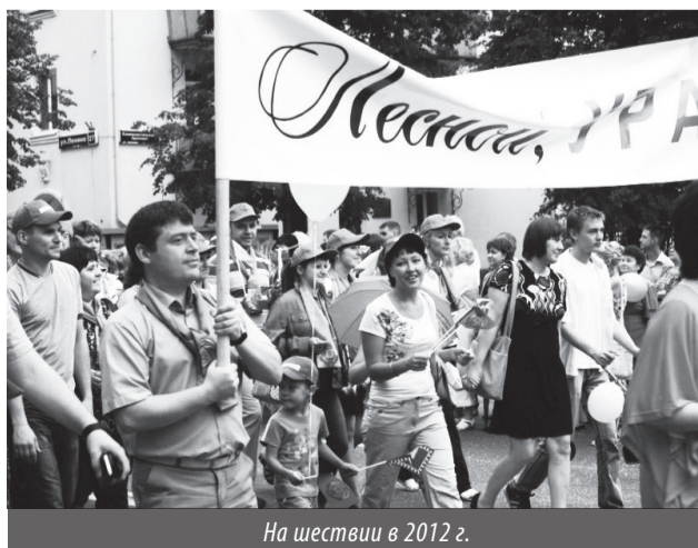
На шествии в 2012 г.

Кроме того, будет проводиться конкурс на лучшую колонну. Праздничные колонны оценят по следующим критериям: идея композиции, целостность образа; художе-