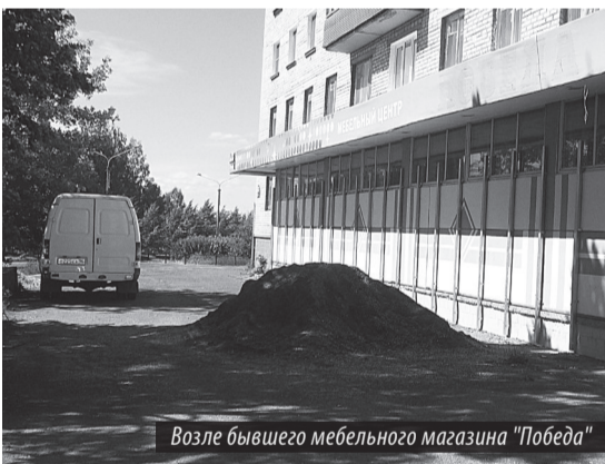
Возле бывшего мебельного магазина «Победа»

В свою очередь чиновники ссылаются на то, что загрузку помещений общественного значения можно выполнять, в том числе со стороны улиц (магистралей). Но никакой магистрали, по словам жильцов, возле их дома, откуда открывался шикарный вид на парк, раньше никогда не было. Вместо нее цвели деревья, в кронах которых без умолка щелкали птицы. Злостную дорожку проложили вопреки СНИПу 2.07.01-89, п. 9.3, категорически запрещающему ее прокладку в зеленой зоне города. Путем варварского отношения уничтожены роскошные яблони, чья высота достигала уровня третьего этажа дома. Они прекрасно защищали окружающую среду от грязи и пыли, блокируя вредные запахи. Кроме того, внедряемый проект с