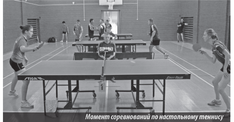
Момент соревнований по настольному теннису