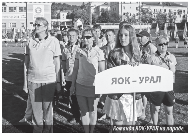
Команда ЯОК-УРАЛ на параде