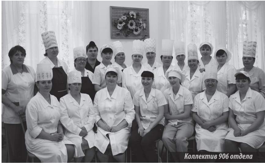
Коллектив 906 отдела

В июле коллектив отдела 906 отмечает 65-летие со дня рождения сферы торговли и общественного питания города