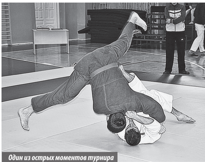
Один из острых моментов турнира