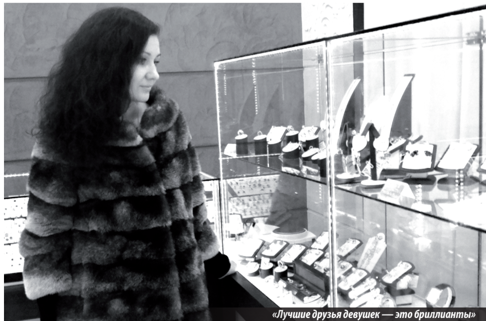
«Лучшие друзья девушек — это бриллианты»