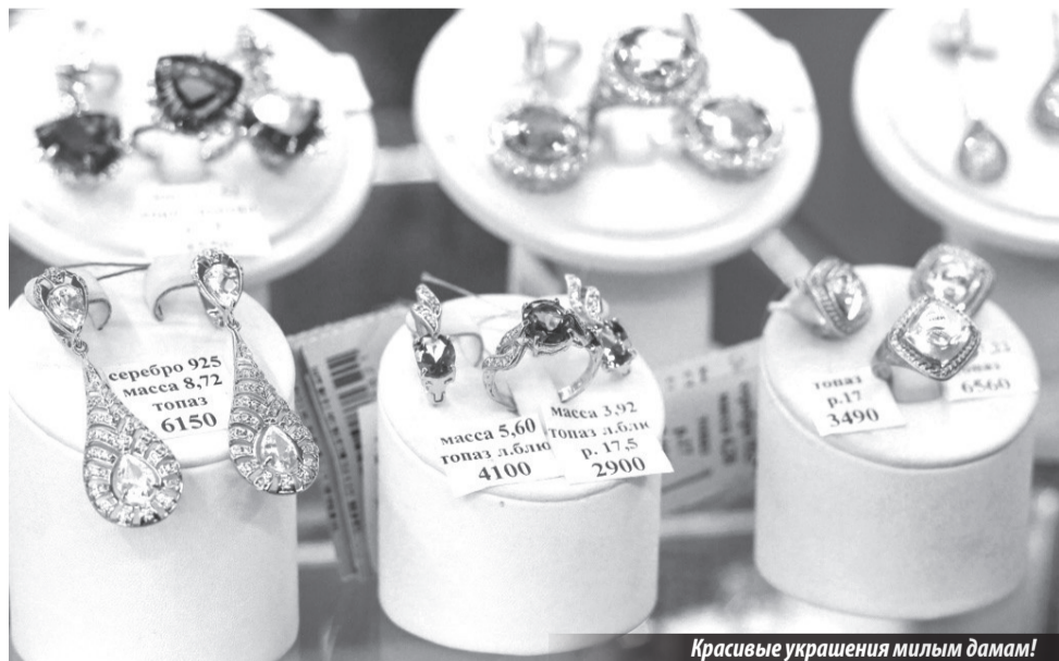
Красивые украшения милым дамам!

С 2003 года сотрудники ювелирного салона «РУССКОЕ ЗОЛОТО» помогают всем желающим выбрать эксклюзивный и, бесспорно, приятный подарок. Здесь вы сможете найти многое: от сережек до кулонов, от браслетов до колец. Все эти ювелирные украшения созданы российскими производителями из Калининграда, Перми, Санкт-Петербурга, Москвы и Якутии. В салоне «РУССКОЕ ЗОЛОТО» представлены изделия разных ценовых категорий, так что любой сможет выбрать подходящее украшение.